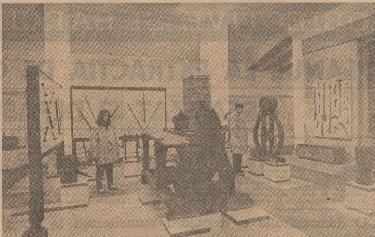
Imagine din secția de etnografie și artă populară a complexului muzeu din Brăila.

„Vasile Lucaclu” de Dan Tărbăla, „Excursia” de Theodor Mănescu, „Concurs de imprejurări” de Adrian Dobotaru, al căror discurs scenic pune în evidență ideea angajării necondiționate a destinului individului în viața complexă a colectivității, în marea destin al patriei. Construit cu finețe și sobrietate, spectacolul „Vasile Lucaclu” de Dan Tărbăla, de pildă, a primit, în regia lui Ioan Ieremia, forța de sugestie și expresivitate unui înălțător simbol: al zborului spre libertate, al luptei pentru idealul dintotdeauna al unui popor, cel al demn-