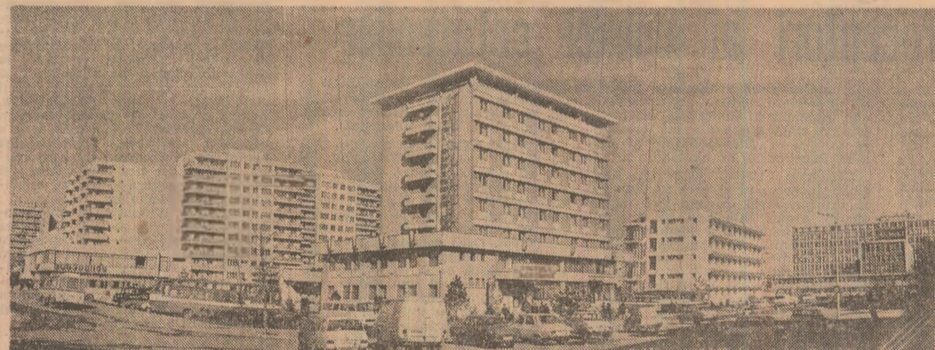
Slobozia acestui timp, mîndră de modernitatea ei citirii