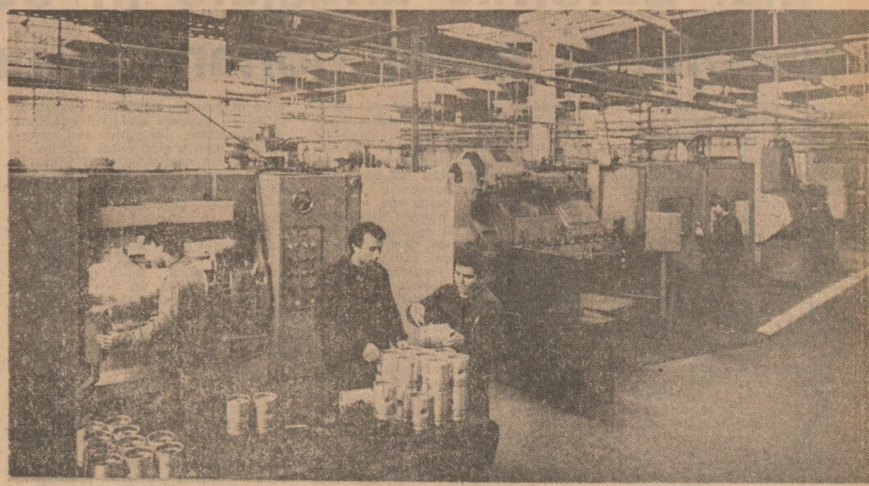
In sectia de prelucrare pistoane, din cadrul Intreprinderii de piese turnate din aluminiu si pistoane auto, din Slatina, se verifica un nou lot de produse

Avind in vedere aceste cerinte, in grupajul de azi ne vom referi la experienta a doua unitati miniere, care si-au indeplinit si depasit planul la productie de carbune.