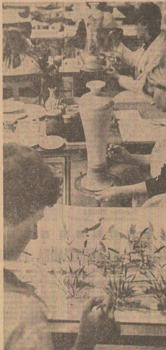
La întreprinderea de faianță și sticlărie „Faimar” din Baia Mare, în atelierul de turnătorie al întreprinderii s-a înființat secțiunea de flori aplicate, unde se execută produse cu volum mic de ardere și grad înalt de prelucrare. În acest sens, s-au asimilat tehnologi noi, s-au căutat noi rețete pentru mase colorate. Ca urmare, acest loc de muncă cere o deosebită îndemnare, măiestrie și simț artistic, ceramicii care lucrează aici avînd un înalt nivel de pregătire. (George Parja).