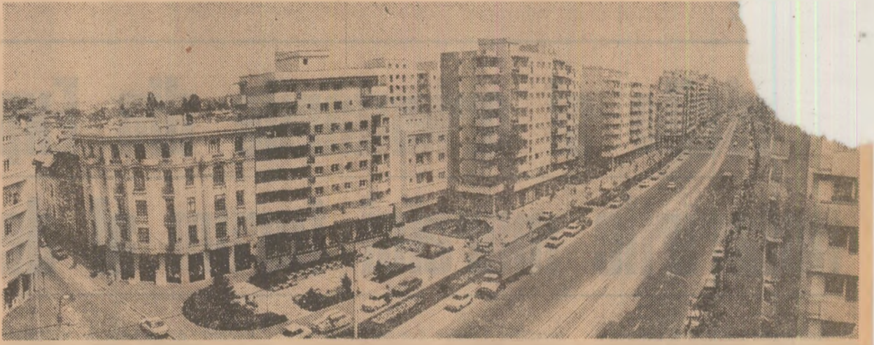
București: construcții frumoase, moderne