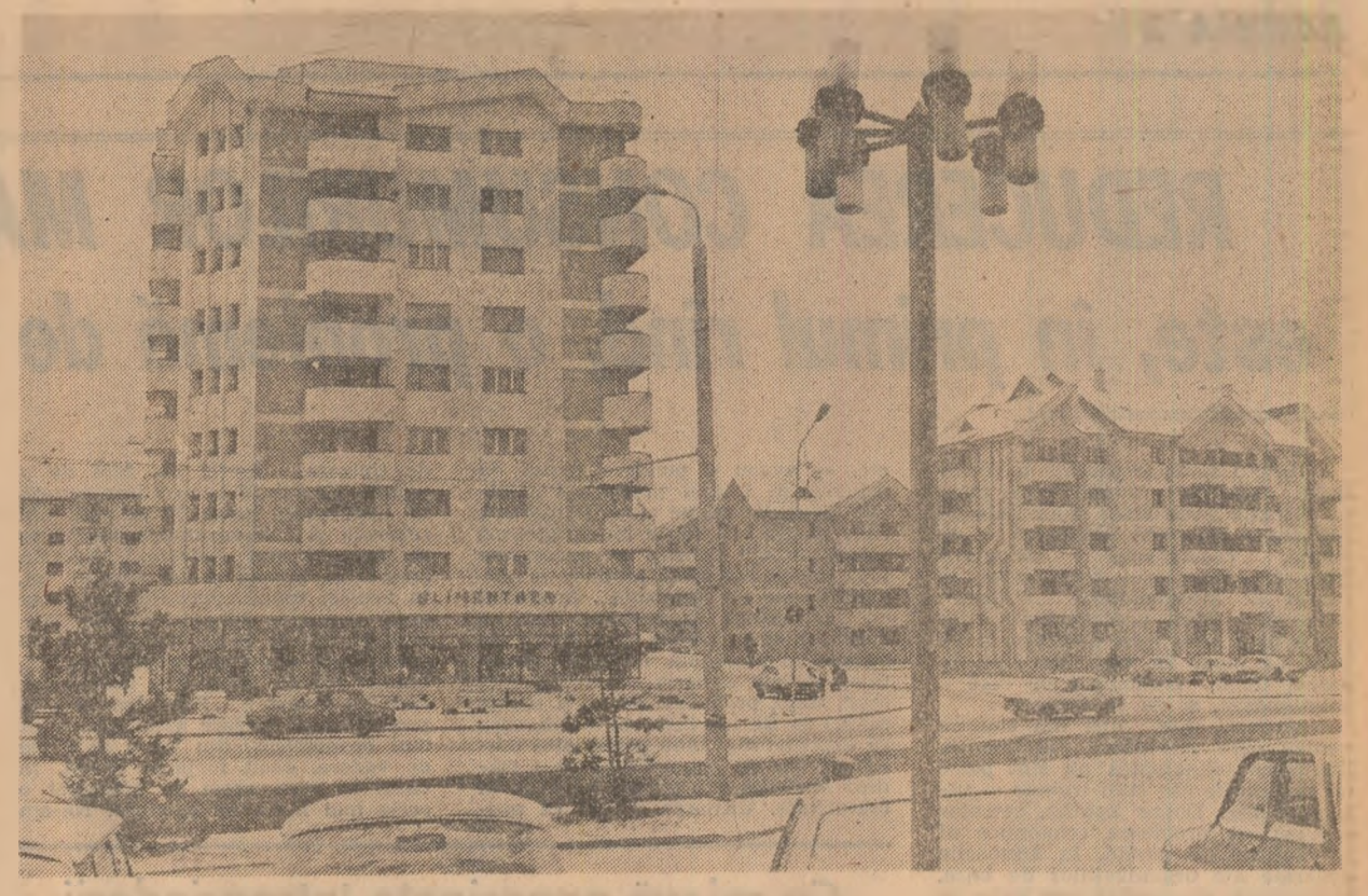
Din noua arhitectură a municipiului Suceava

Viaicu RADU (Continuare în pag. a III-a)