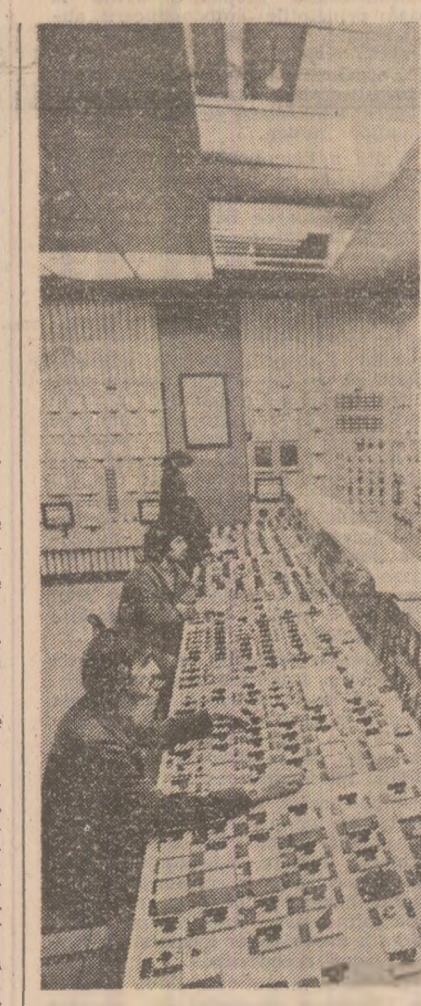
La termocentrala Mintia-Dava se acordă cea mai mare atenție funcționării riguroase a agregatelor energetice. În fotografie, aspect din camera de comandă.