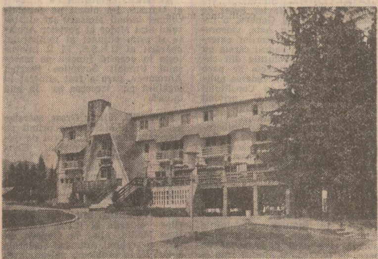
Hanul Soveja, județul Vrancea