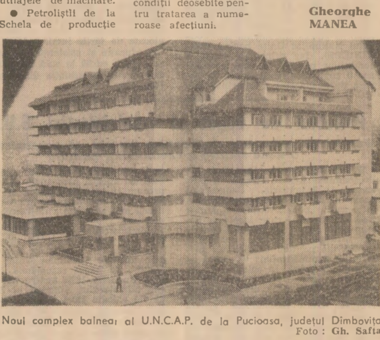
Noul complex bolnec al U.N.C.A.P. de la Pucioasa, județul Dimbovită