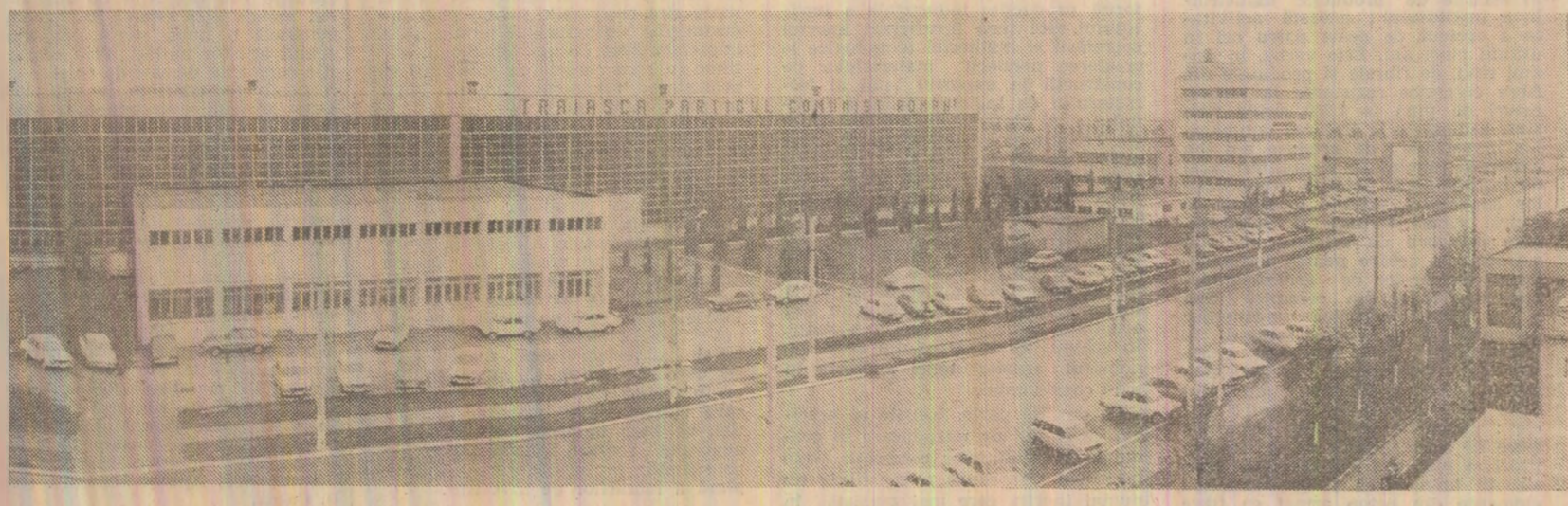
Imagine din zona industrială a Sibiuului