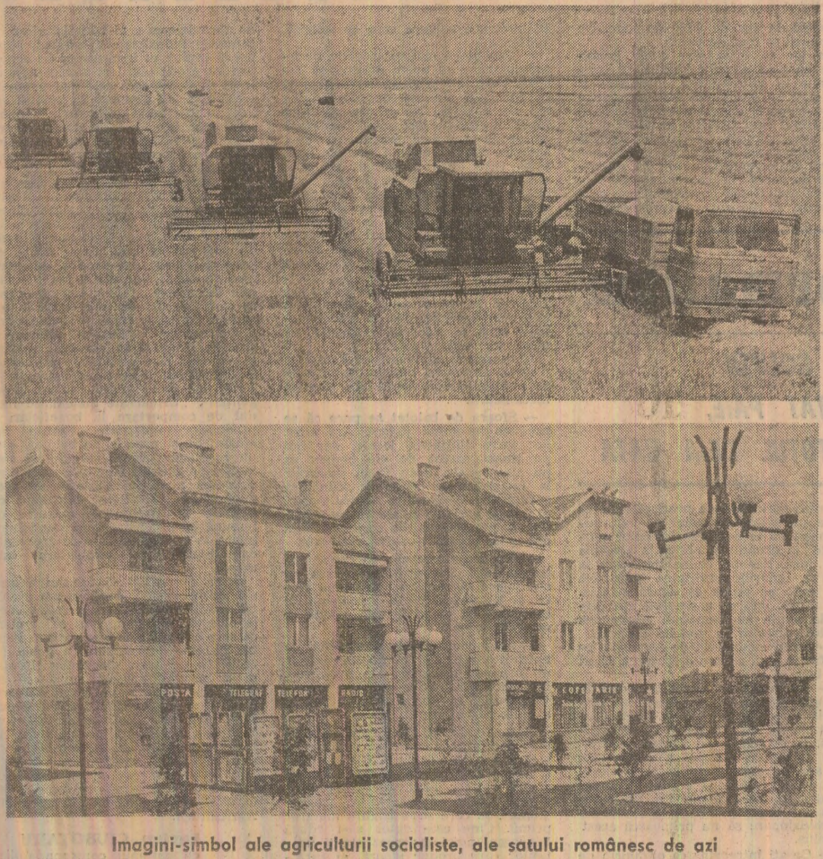
Imagini-simbol ale agriculturii socialiste, ale satului românesc de azi

Avînd în vedere aceste cerințe, redacția a organizat cu sprijinul Comitetului Județean Argeș al P.C.R. o dezbateri în cadrul căreia mai mulți specialiști și factori de răspundere din întreprinderi au prezentat atît experiența acumulată, cît și o serie de probleme ce trebuie rezolvate pentru reducerea mai accentuată a consumurilor materiale, pe care o publicăm sub titlul „SPUNE-MI CU CE CHELTUIELI PRODUCI, CA SĂ-ȚI SPUN CUM MUNCEȘTI”. În pagina a II-a.