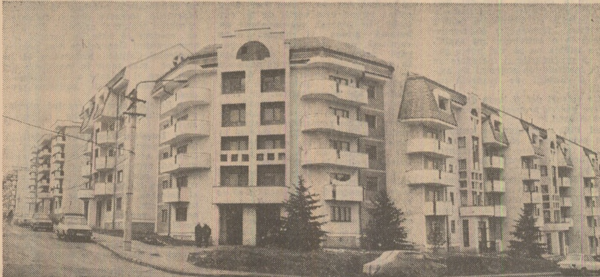
Amoioasă împletire de modern și tradiție în municipiul Cluj-Napoca