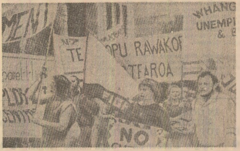
Uno din marile demonstrații ale oamenilor muncii neozelandezi împotriva creșterii șomajului, pentru condiții mai bune de viață și muncă

perioada postbelică etc. Toate aceste schimbări în structura economică a țării, apreciate de presa neozelandeză drept „o revoluție pașnică”, au determinat unele rezultate negative a populației locale. Liderul ultrasrăștii a arătat că se impune ca guvernul sud-african să abandoneze ideea retragerii trupelor sale din teritoriu, ceea ce înseamnă împiedicarea procesului de obținere a independenței Namibiei, conform rezoluției Consiliului de securitate pentru decolonizarea teritoriului și desfășurarea de alegeri libere pentru organe democratice ale puterii de stat și administrative.