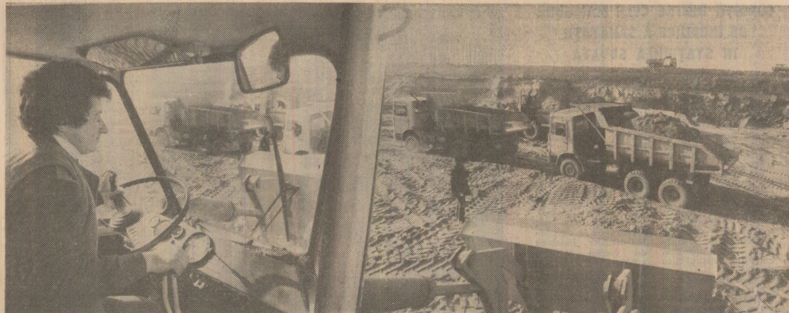
Aspect cotidian, de muncă, la Amenajarea complexă a rîului Argeș