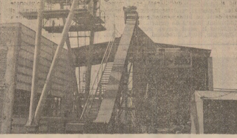
Instalația de pregătire a spanului o întreprinderii de utilaj tehnologic a increment, nimeni nu mai știe de cind, și a rămas pradă rușinii.