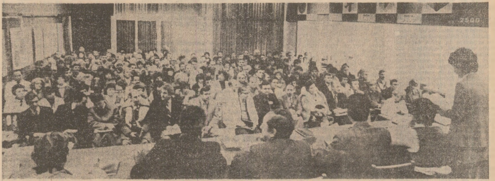
Adunările generale ale oamenilor muncii constituie cadrul cu cele mai largi posibilități de afirmare a capacității de inițiativă și a răspunderii colectivei de muncă. În imagine, aspect de la adunarea generală a oamenilor muncii, care a avut loc în aceste zile la I.P.R.S. Băneasa din Capitală.

Legătura indisolubilă între conducerea unitară și autoconducerea coasă în faptul că organele democratice ale întreprinderilor iau decizii în conformitate cu planul național unic, că rolul planificării unitare a întregii activități economice se completează cu largi competențe de elaborare pentru unitățile economico-sociale. Aceste rapoarte, dintr-o parte, asigură în ultimă instanță precizarea și respectarea rolurilor fiecărei unități în diviziunea socială a muncii în țara noastră, și de ce este necesar, în concordanță cu interesele generale ale societății.