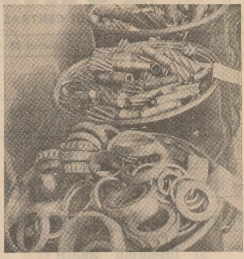
În recipiente separate, pe grupe de mărci, așa trebuie colectate și livrate oțelurile aliate! — arată imaginea surprinsă pe pelicula fotografică la I.L.V.M.R. Buzău

Mergând la depozitul de metale refolosibile al întreprinderii îi înțelegem rezervații. Depozitul se distinge de restul depozitelor prin faptul că are o înălțime de peste 10 metri și este înconjurat de o grădă de cind, a instalației de pregătire a spanului, lăsată pradă rușinii. Pe de altă parte, prin grămezile de span și al metale profilate lângă zidul unei construcții, în depozit... țipenie. În sfârșit, apare un muncitor care susține că are ceva în grădă. Depozitul, între timp sosesse un motorcu trimis din secția de cazangerie grea cu două containere conținând resturi metalice nu se știe de ce proveniență și a unui muncitor de sirmă de cupru. După ce am văzut, în depozitul de oțeluri, doar din cind în cind, spre sfârșitul lunii, se întocmesc note de credite. Cercetăm câteva din aceste documente: nici unul nu poartă viza organizării generale existente în fabrică. Nici n-are pe cine să poarte pentru că nu există nici o corespondență între datele întocmirii documentului și data livrării efective a materialelor de care au rezultat, precum și cu ce întocmeste nici registrul de evidență pentru recuperarea și valorificarea materialelor refolosibile, potrivit legii. Practic, așa cum aveam să recunoaștem atât contabilul-șef, cât și directorul comercial, ing. Constantin Tudosă, în această întreprin-