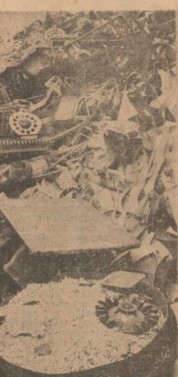
Alchimistii doreau cindva să preschimbe fierul în aur. In varianta modernă, adunul în cur. In varianta otel, multă tabă silicioasă și ceva aluminiu. Oare ce are să iasă de aici?