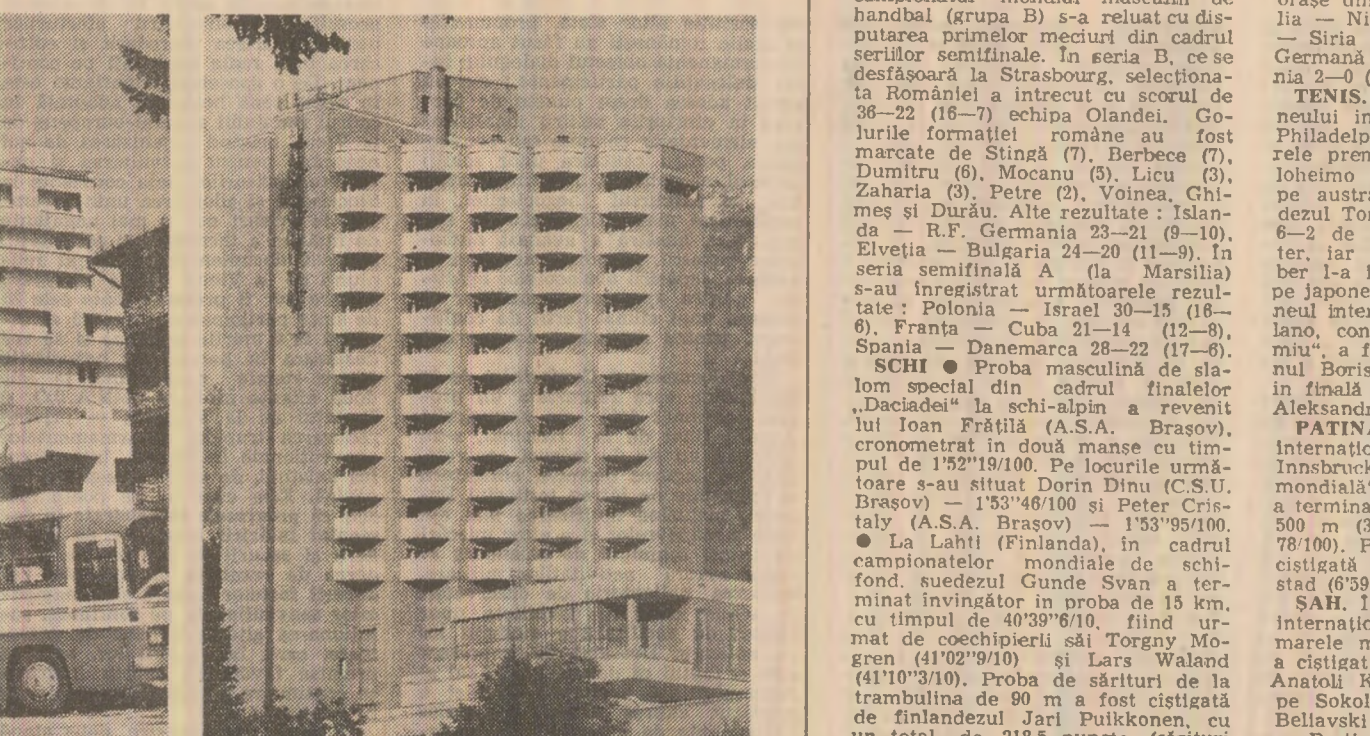
odihnă de diferite grade de confort, asigură servirea mesei în restaurante și pensiuni. Personal medical de înaltă calificare aplică proceduri terapeutice eficiente pe baza factorilor naturali de cură...