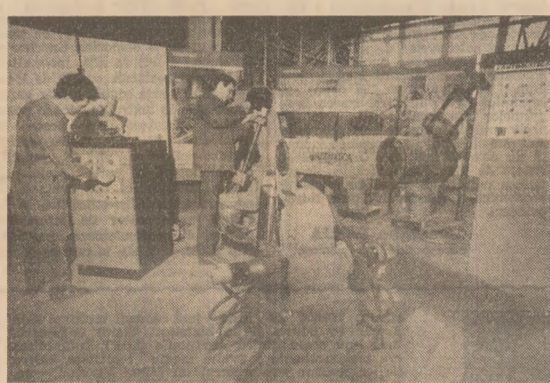
Prestigiosul colectiv de specialiști și muncitori din cadrul întreprinderii „Automecanic” București se situează permanent în fruntea acțiunii de modernizare și înnoțire a industriei românești pe plan tehnic. În imagine, aspect de la montajul unui robot industrial de sudură în puncte.

Întreaga activitate productivă, prin buna organizare a muncii, prin creșterea răspunderii tuturor față de realizarea sarcinilor de plan. Nereușitele de anul trecut, printre care acestea în cazurile care au fost cauzate de muncitori — piese turnate din oțel, piese forjate, matrite, piese turnate din neferoase, mașini-unelte de prelucrare prin așchiere sau prin deformare plastică, piese hidraulice și altele — dovedesc că, așa cum s-a arătat în adunarea generală, organelle și organizațiile de partid, consiliul oamenilor muncii nu au adoptat cele mai eficiente măsuri pentru utilizarea integrală a timpului de lucru și a capacităților de producție, pentru îndeplinirea ordinii și disciplinei.