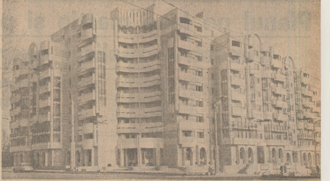
Urbanistică modernă la Constanța