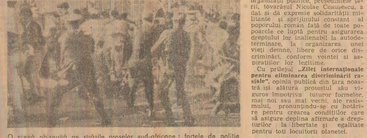
O scenă obișnuită pe străzile orașelor sud-africane: forțele de poliție reprimind cu brutalitate o demonstrație împotriva politicii de apartheid