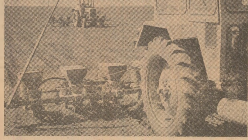
La semănatul porumbului, pe terenurile Cooperativei Agricole Jigănești, județul Teleorman.