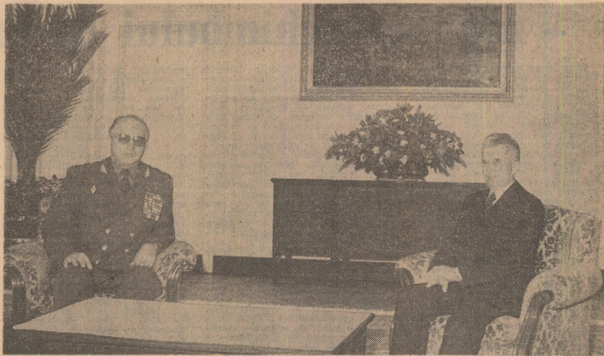
Tovarășul Nicolae Ceaușescu, secretar general al Partidului Comunist Român, președintele Republicii Socialiste România, comandantul suprem al forțelor armate ale Republicii Socialiste România, a primit, marți, 4 aprilie, pe generalul de armată P. G. Lușev, comandant-șef al Forțelor Armate Unite ale statelor participante la Tratatul de la Varșovia, și pe generalul de armată V. N. Lobov, șeful Statului Major al Forțelor Armate Unite, care au efectuat o vizită în țara noastră.

a primit pe generalul de armată P.G. Lușev