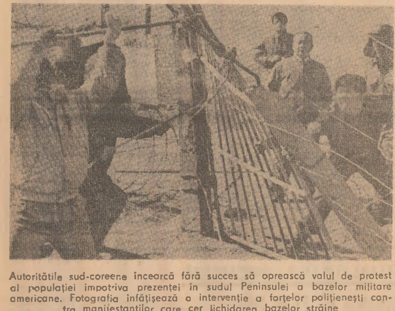
Autoritățile sud-coreene încearcă fără succes să oprească volul de protest al populației împotriva prezenței în sudul Peninsulei a bazelor militare americane. Fotografia infățișează o intervenție a forțelor polițienești contra manifestanților care cer lichidarea bazelor străine