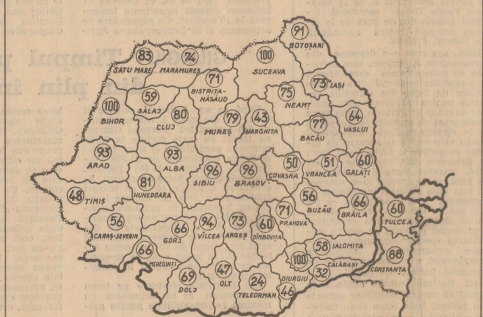
Stadiul plantării cartofilor de toamnă, în procente pe județe, la data de 4 aprilie (date furnizate de Ministerul Agriculturii)

Sarcinile deosebit de mari care stau în fața oamenilor muncii din agricultură în această perioadă obligă, înainte de toate, la o reevaluare critică a măsurilor pe care trebuie să le întreprindă organele și organizațiile de partid de la sate, în vederea intensificării la maximum a tuturor lucrărilor ce se execută acum în agricultură. Subliniem această cerință intrucît trebuie spus că nu în toate locurile se acționează cu fermitate și răspundere necesare în vederea îndeplinirii neajunsurilor ce și-au făcut loc în organizarea muncii și folosirea la întreaga capacitate a mijloacelor mecanice, neajunsuri care constituie, de fapt, principala cauză a întârzierilor mari la semănat, pe care înregistrăm acum la maximum a tuturor lucrărilor ce se execută acum în agricultură. Subliniem această cerință intrucît trebuie spus că nu în toate locurile se acționează cu fermitate și răspundere necesare în vederea îndeplinirii neajunsurilor ce și-au făcut loc în organizarea muncii și folosirea la întreaga capacitate a mijloacelor mecanice, neajunsuri care constituie, de fapt, principala cauză a întârzierilor mari la semănat, pe care înregistrăm acum la maximum a tuturor lucrărilor ce se execută acum în agricultură.