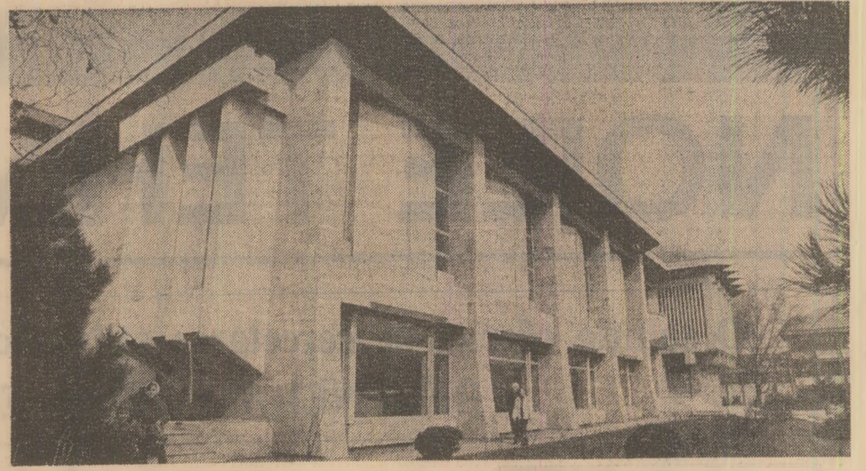
Centrul de cultură și creație „Cîntarea României” al sindicatelor din Rîmnicu Vilcea