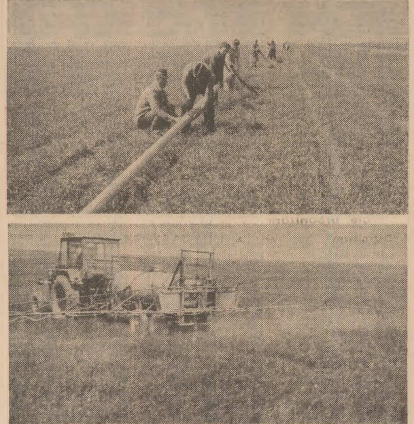
Doză lucrări la ordinea zilei: irigarea culturilor de grâu și orz pe terenurile Cooperativei Agricole de Producție Igișnești, județul Teleorman...