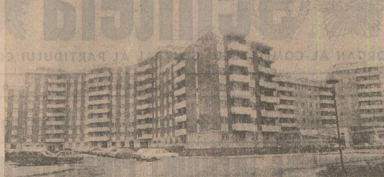
Noi construcții de locuințe în zona de nord a Brașovului

Nu mai puțin semnificative pentru spiritul gospodăresc al brașovenilor sint acțiunile curente de înfrumusețare și întreținere a fondului locativ, a străzilor și trotuarelor, a spațiilor verzi și parcurilor. Printre acestea se numără refacerea și zugrăvirea fațadelor clădirilor vechi din zona centrală a orașului, amenajarea unor parcuri ca aceea din apropierea Teatrului Dramatic și a poliției județene sau cel din zona „Temelia” etc. În acest sens se cuvine evidențiată și o altă inițiativă valoroasă a brașovenilor: plantarea