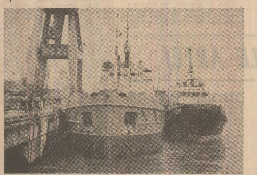
Imagine de la întreprinderea de Construcții Navale și Prelucrări la Cald din Drobeta-Turnu Severin