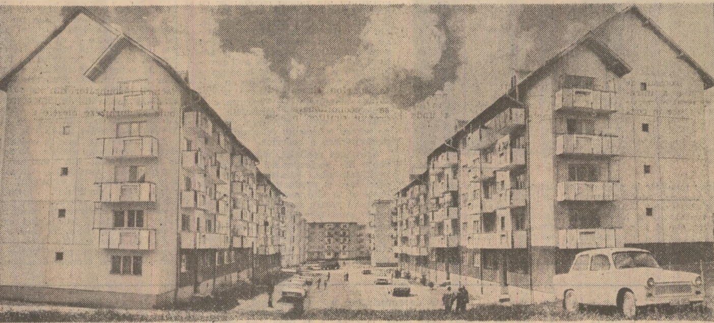
Noi simetrii constructive la AVRIG

să urmează să se construiască în viitorii ani, creîndu-se, totodată, 60 de noi locuri în grădinițe. Alți optunite, citiși șanșele de muncă la Avrig sînt multiple. Cu toate că Avrigul a dobîndit statutul de oraș doar de cîteva zile, conturul lui viitor e prefigurată de schița de sistemalizare care cuprinde un centru orășenesc, numeroase dotări social-culturale care conferă atribute urbane suplimentare și un confort sportiv celor 16.000 de locuitori ai săi. Iar ambiția localnicilor este de a face din localitatea lor un oraș model, muncind pentru această perspectivă cu pasiune și dăruire. Devenind centru urban, Avrigul deschide orizonturi de istorie nouă în Cartea Oltului.