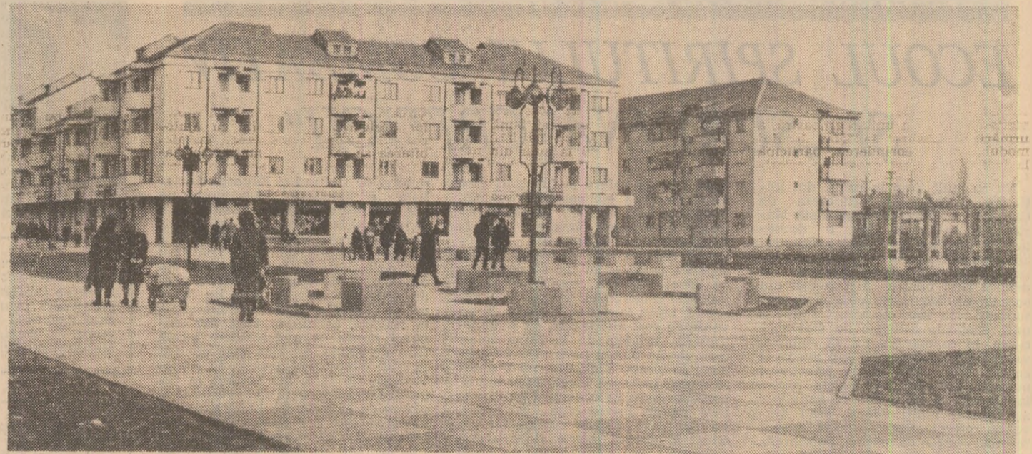
Imagine semnificativă din IANCA