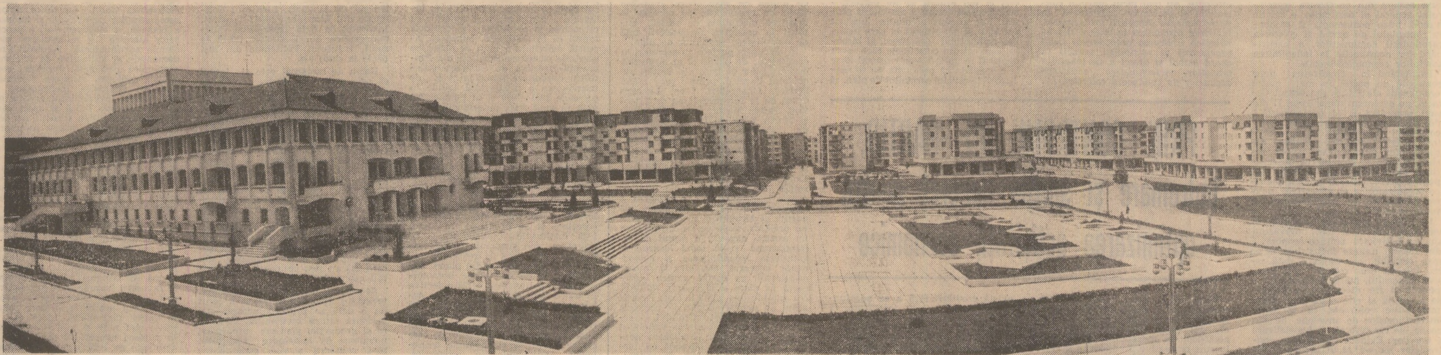
COLIBAȘI — un oraș pe măsura timpului pe care-l trăim