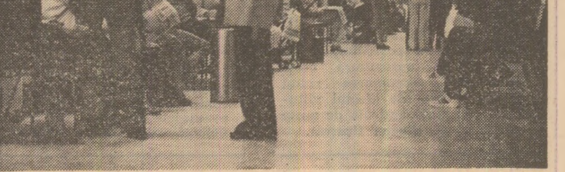
Chinuitoarea — și zadarnica — așteptare a unei oferte de serviciu

Era în mai 1988. De atunci, nici o ofertă.