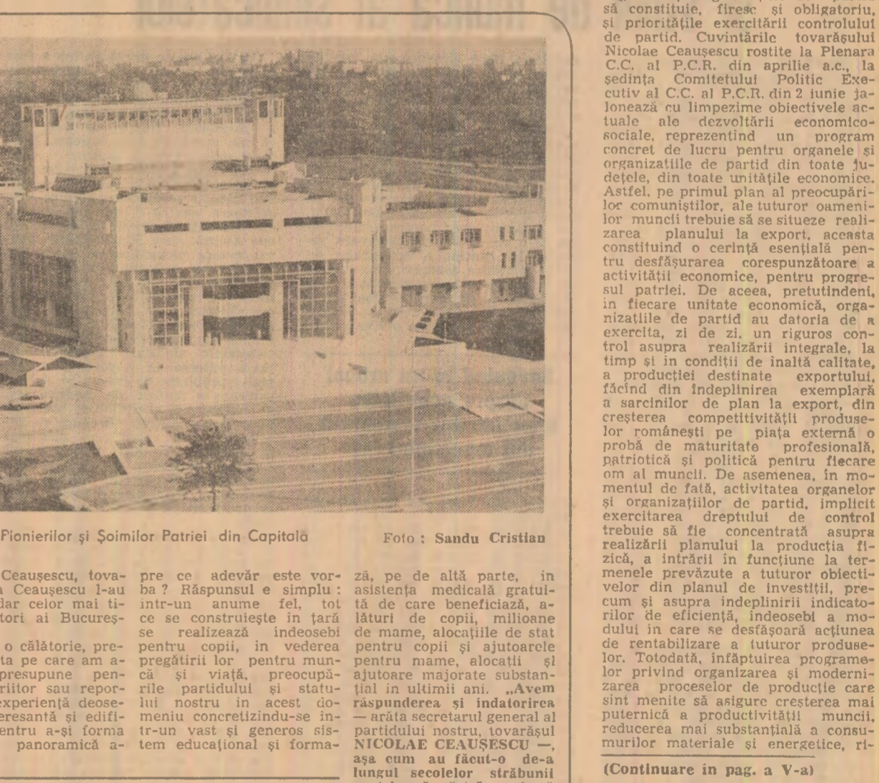
Casa Pioneerilor și Șoimilor Patriei din Capitală

buna desfășurare a întregii activități, în democratizarea și participarea activă la conducerea tuturor activităților în întregul ansamblu a planurilor și programelor de dezvoltare economică și socială a patriei noastre, a întregii națiuni, a poporului nostru. Din perspectiva acestei imperativități, organele și organizațiile de partid au datoria ca, odată cu conceperea întregii munci organizatorice pentru îndeplinirea hotărîrilor de partid și a legilor țării, a propriilor hotărîri, programe și planuri de muncă să inițieze acțiunile eficiente privind modul de înfăptuire a acestora.