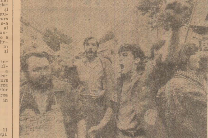
Franta. Demonstrație de protest împotriva politicii de austeritate salariale preconizată pentru anul fiscal 1990 și a creșterii șomajului.