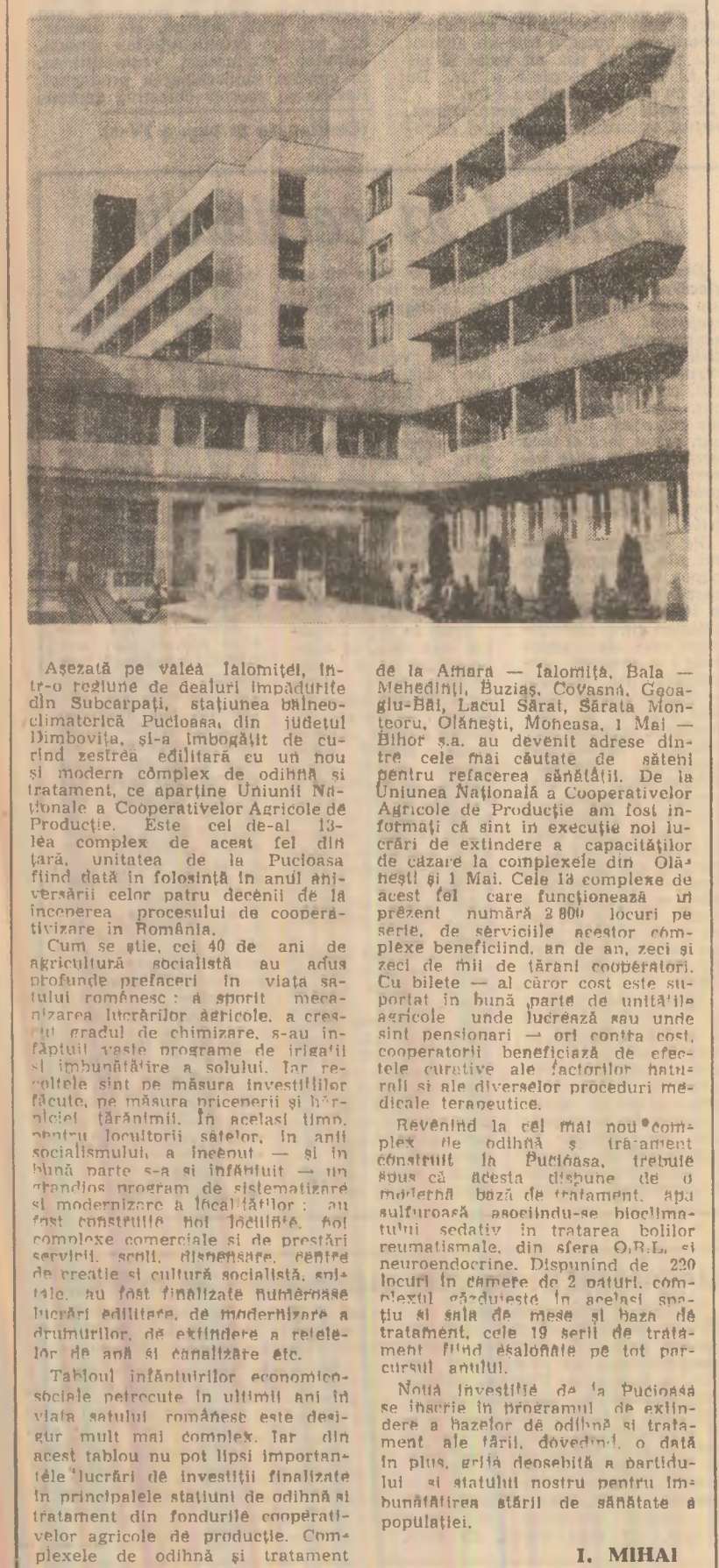
Așezată pe valea Ialomiței, într-o regiune de dealuri împădurite din Subcarpații, stațiunea balneoclimatică Pucioasa, din județul Jumbovia, și-a îmbogățit de curând sfera de activitate cu un nou și modern complex de odihnă și tratament, ce aparține Uniunii Naționale a Cooperativelor Agricole de Producție. Este cel de-al 13-lea complex de acest fel din țară, unitatea de la Pucioasa fiind dată în folosință în anul aniversării celor patru decenii de la începerea procesului de cooperativizare în România.

de la Amara — Ialomița, Bala — Mehedinți, Buzias, Covașna, Gogaș-Băl, Lacul Sărat, Sărata Monteoru, Olănești, Moheșna, 1 Mai — Bihor s.a. au devenit adrese din care cele mai căutate de săteni sunt refugia sănătății. De la Uniunea Națională a Cooperativelor Agricole de Producție am fost informată că sînt în execuție noi lucrări de extindere a capacităților de cazare la complexele din Olănești și 1 Mai. Cele 13 complexe de acest fel care funcționează azi, prezintă numărul 2.800 locuri pe serie, de servicii acestor complexe beneficiind, an de an, zeci și zeci de mii de țărani operatori.