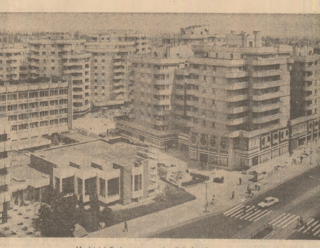
Municipiul Craiova, un oraș în plină dezvoltare

„Aceleste artele vii sînt cea mai rentabilă investiție”, adaugă interlocutorul. Cum a rambursat cîmpia ceea ce a primit? O spune inginerul-sef. Dacă în 1975, cînd abia se fertilizau cîte 350 hectare pe an și cînd aproape jumătate din terenuri aveau o fertilitate slabă, cooperativa producea mai puțin de 7.000 tone cereale, acum, pe aceleași suprafețe, se obțin de peste trei ori mai mult. Dacă în 1975 pămîntul de aici producea sîmburi pentru furajarea animalelor cel mult 15.000 tone diferite nutrețuri, inclusiv furajele secundare, astăzi, pe aceeași suprafață, se realizează circa 60.000 tone furaje, dintre care numai succulențele reprezintă circa 31.000 tone. „Am îmbobîntit pămîntul prin animale pentru ca acesta, la rîndul lui, să ne permită să ne înecăm efectivele”, ne spun