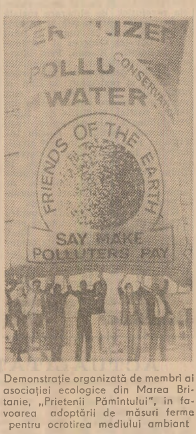
Demstrație organizată de membri ai asociației ecologice din Marea Britanie, „Prietenii Pământului”, în favoarea adoptării de măsuri ferme pentru ocotirea mediului ambiant

Pe de altă parte, în ultimii doi ani, producția de grâu s-a redus, fiind sub nivelul necesarului în acest domeniu. În 1988, cantitatea de grâu existentă în depozite era de numai 297 milioane tone, ceea ce reprezintă o reducere cu 2,8 la sută față de anul precedent și numai 16 la sută din necesarul de consum pe anul 1989 (această cantitate este sub nivelul de siguranță indispensabil în privința cerealelor pe plan mondial, 17-18 la sută din consum).