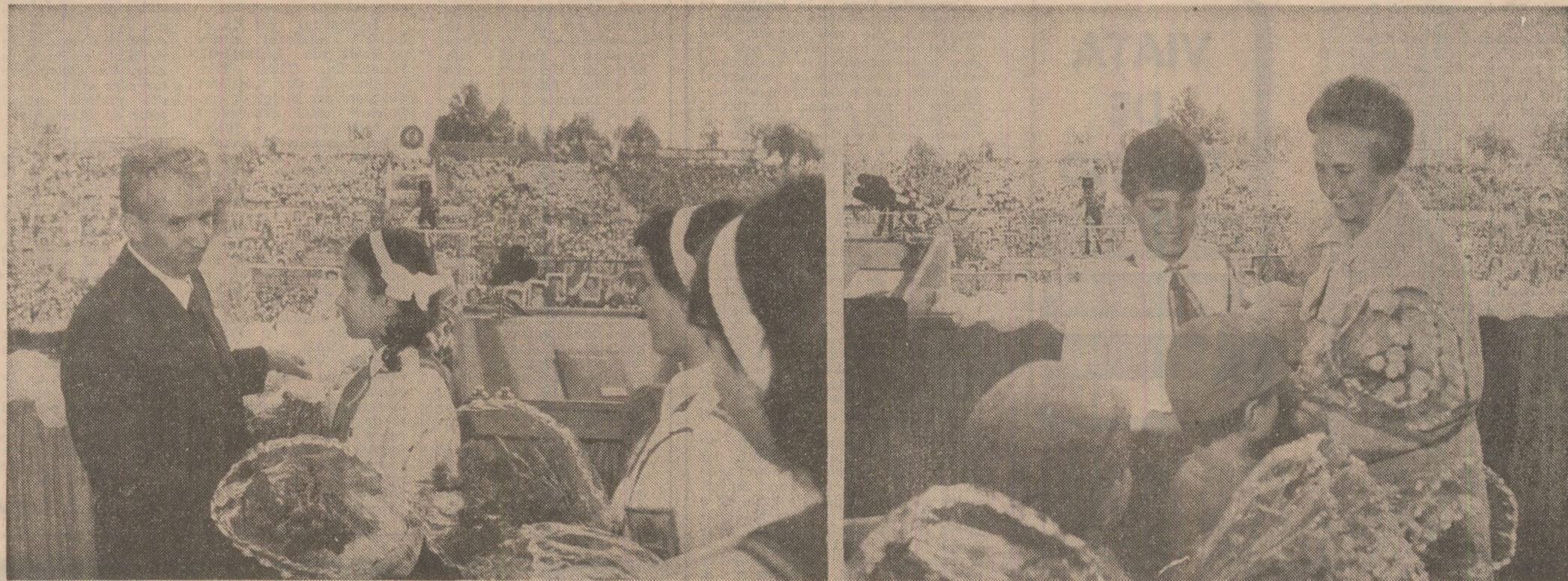
Din adîncul inimilor, flori de aleasă recunoștință conducătorilor iubiți

● Pionierii, școlarii și șoimii patriei vor fi prezenți peste cîteva zile în tabere organizate în stațiuni balneoclimaterice, în alte localități, la munte și la mare, în cele mai pitorești colțuri ale patriei. ● În vacanța Iul 1989, 300 de tabere și colonii vor găzdui 65 000 de pionieri și școlari pe serie. ● Numai tabăra republicană de la Năvodari va primi anul acesta 80 000 de copii. ● Profilurile diverse ale taberelor de odihnă și instruire reflectă bogăția de preocupări pionierești, cunoștințele și deprinderile dobîndite în orele de curs, aptitudinile, pasiunile cultivate cu grijă în școala românească: tabere cu caracter tehnico-aplicativ, cultural-artistice și de masă, sportiv, turistic și de pregătire pentru apărarea patriei și.a. ● Expedițiile „Cutezătorii”, prin locurile de neamsmulță frumoase ale țării, pline de istorie, antrenează la drumete peste 27 000 pionieri și școlari. ● În excursii și drumeții județene și interjudețene sînt invitați anual peste 1 500 000 pionieri și școlari. ● La întrecerile sportive organizate în toate județele țării pe timpul vacanței participă peste 1,5 milioane de pionieri și școlari.