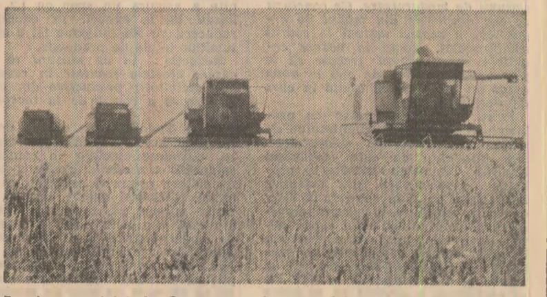
Recoltarea grîului la Cooperativa Agricolă Odoreu, județul Satu Mare

In telegrama adresată tovarășului Nicolae Ceaușescu, oamenii muncii din 10 județe și sectorul agricol Ilfov au raportat încheierea recoltării grîului și obținerea de recolte mari la această cultură. Așa cum s-a subliniat la recenta ședință a Comitetului Politic Executiv al C.C. al P.C.R., datorită muncii hardice a țăranimii cooperatiste, a tuturor lucrătorilor și specialiștilor din agricultură, executării la timp și de calitate a lucrărilor agricole, aplicării largi a cuceririlor științei și agrotehnicii moderne, în acest an s-a obținut cea mai mare producție de orz — de peste 7 000 kg la hectar în medie pe țară. La propunerea tovarășului Nicolae Ceaușescu, Comitetul Politic Executiv al C.C. al P.C.R., în loc de 5 la sută, cit se acordă pînă acum cooperatorilor, să se atribue un procent sporit, de 8 la sută. Această măsură, care constituie o nouă dovadă a preocupărilor constante ale conducerei partidului pentru creșterea producției agricole și, pe această bază, a nivelului retribuirii, va răsi un larg ecou în rîndurile țăranimii, stimîndu-i și mai mult coerența, spiritul de ordine și disciplină în vederea efectuării la timp și de bună calitate a tuturor lucrărilor agricole. Și la grîu există condiții pentru obținerea unor recolte superioare. In telegrama adresată tovarășului Nicolae Ceaușescu de Comitetul Județean Brăila al P.C.R., publicată în pagina de față, se raportează că s-au realizat 9 110 kg grîu la hectar. De altfel, cele 10 județe și sectorul agricol Ilfov,