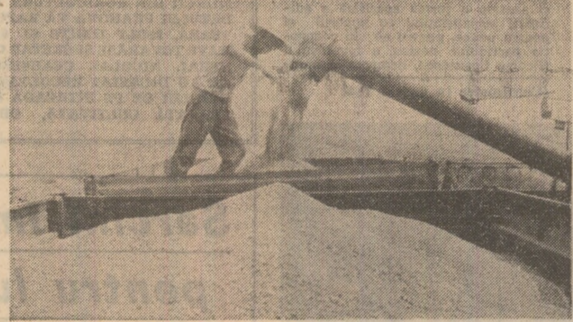
În unitățile agricole din județul Satu Mare griul recoltat este transportat direct la baza de recepție