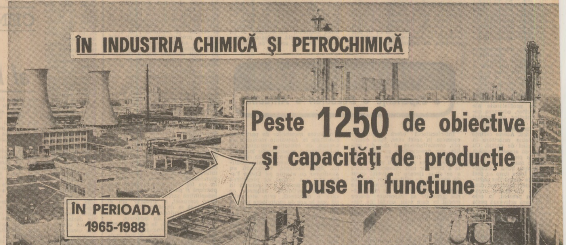
ÎN INDUSTRIA CHIMICĂ ȘI PETROCHIMICĂ