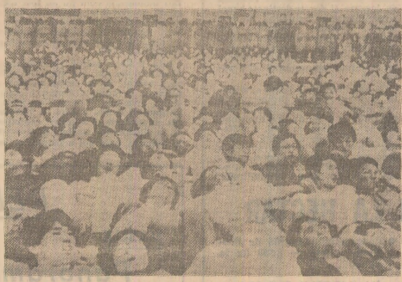
Recent, mii de invătători au protestat, la Seul, împotriva politicii antidemocratice a autorităților sud-coreene. Detachamente speciale ale poliției, trimise împotriva demonstrațiilor, au arestat circa 2000 de invătători.

În acest context, ministrul argentinian și-a exprimat speranța că se va ajunge la o rezolvare rapidă a situației. „Guvernul președintelui Carlos Saul Menem nu va renunța să reclame suveranitatea argentiniană asupra Malvinelor, dar tema poate rămâne în suspensie și se pot discuta alte puncte care contrapun țările respective” — a spus Domingo Cavallo.