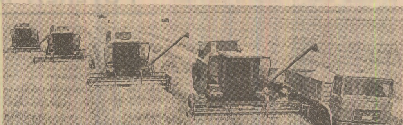
PAGINA A II-A