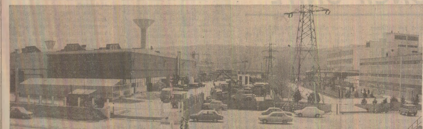
PAGINA A III-A