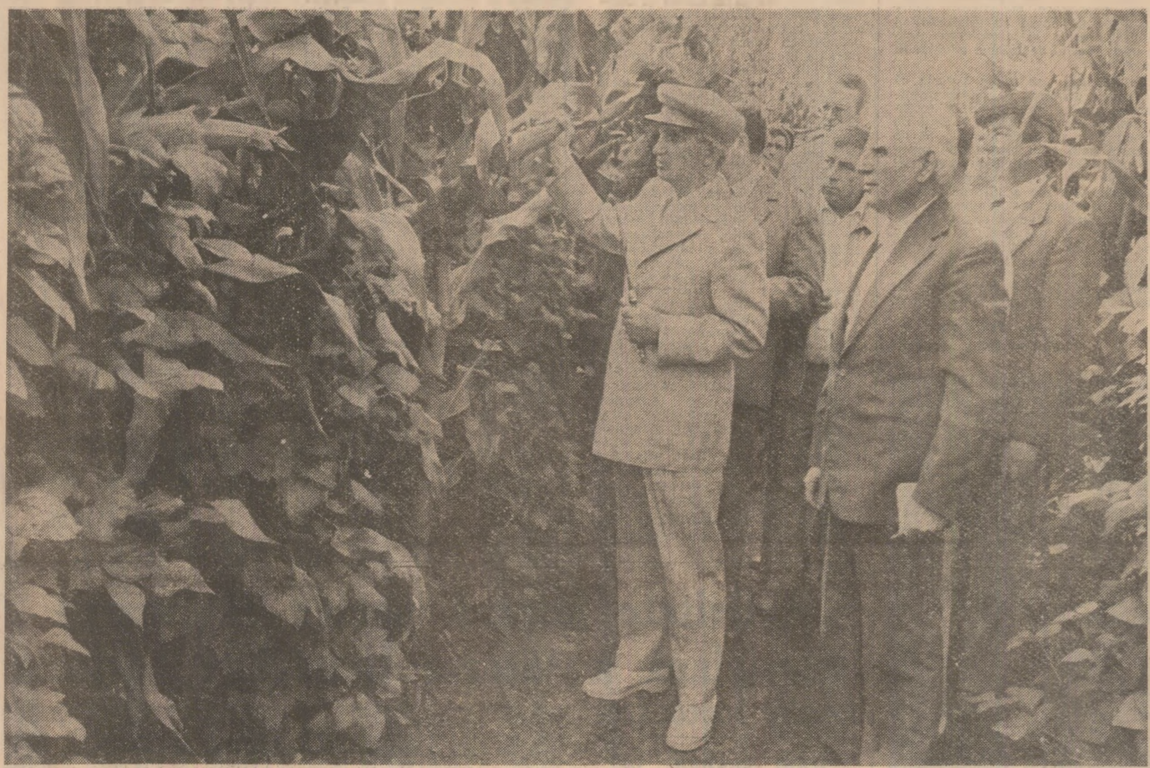
Tovarășul Nicolae Ceaușescu, secretar general al Partidului Comunist Român, președintele Republicii Socialiste România, a efectuat, miercuri, 16 august, o vizită de lucru în unități agricole din județele Teleorman și Giurgiu și pe șantierul de amenajare complexă a râului Argeș.

Desfășurată în atmosfera de puternică angajare patriotică, revoluționară, a oamenilor muncii din întreaga țară pentru împlinirea integrală a sarcinilor de plan pe opt luni, pînă la apropiata sărbătoare națională a poporului român de la 23 August, și de întregul an, pînă la Congresul al XIV-lea al partidului, vizita a prilejuit examinarea, la fața locului, a modului în care au fost organizate și se desfășoară sîrînzarea și depozitarea recoltelor, pregătirea în cele mai bune condiții a însămînțării de toamnă, în vederea realizării producțiilor stabilite, la toate culturile, corespunzător prevederilor din plan. Au fost analizate, de asemenea, în spiritul orientărilor și indicațiilor date de secretarul general al partidului la recenta Plenară largită a Consiliului Național al Agriculturii, Industriei Alimentare, Silviculturii și Gospodăririi Apelor, măsurile întreprinse în vederea îndeplinirii programelor prioritare din această ramură de bază a economiei naționale, ridicării permanente a întregii activități din agricultură la cote superioare de eficiență și calitate, astfel încît să se asigure realizarea cu succes a obiectivelor noi revolutivii agricole, a prevederilor din proiectul Programului-Directivă pen-