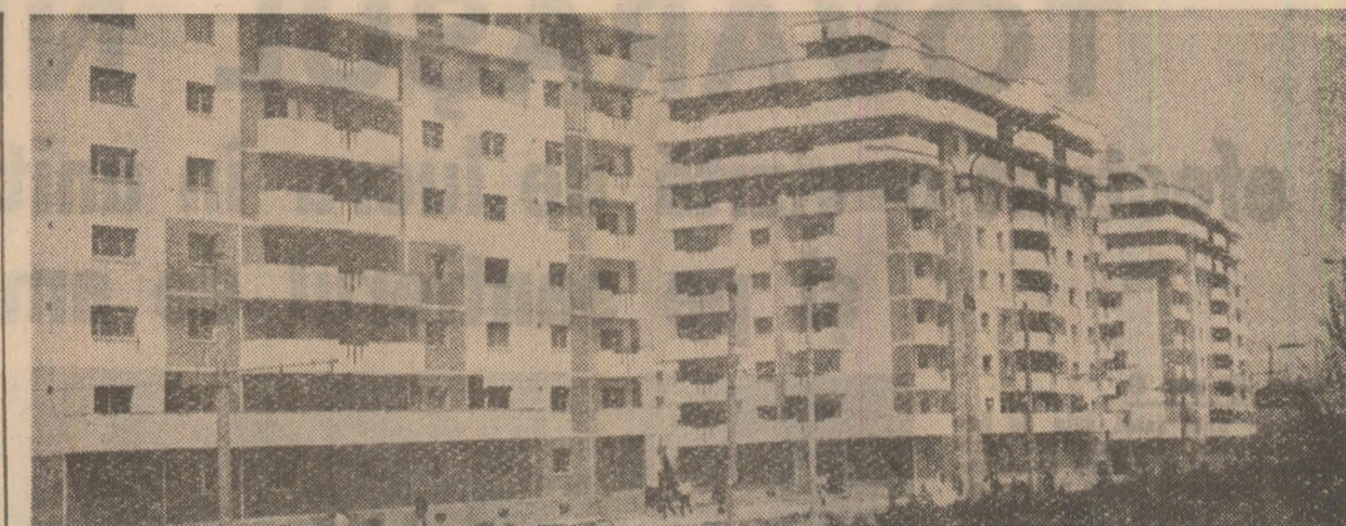
Construcții noi de locuințe în municipiul Cluj-Napoca

Invățămîntul românesc a parcurs în perioada înaltă de dezvoltare a lui în perioada 1944-1989, în anii interbelici și politica sa de Front Național Unic din perioada pregătirii și realizării revoluției de la 23 August 1944.