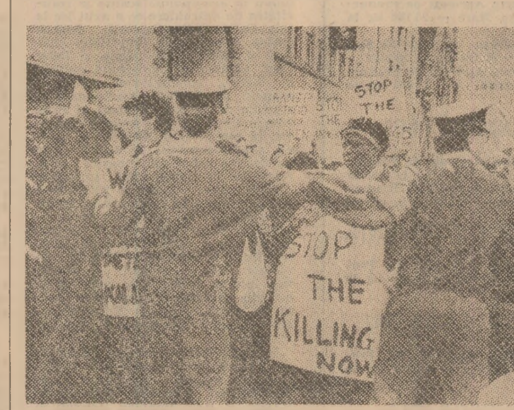
În R.S.A., în ciuda opoziţiei poliţiei, au loc numeroase demonstraţii de protest împotriva politicii de apartheid