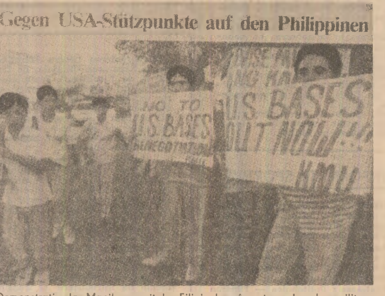
Demonstrație la Manila, capitala Filipinelor, împotriva bazelor militare americane din țară

rat că negocierile americano-singaporeze nu vor afecta decizia administrației sale cu privire la soarta bazelor americane din țară, hotărîrea urmînd a fi luată, în primul rînd, în funcție de interesele naționale. Ca un reflex al stării de spirit existente în regiune, parlamentarii din țările membre ale S.U.A. au fost nevoiți să accepte decizia spaniolă. Baza aviatică a fost transferată în Italia, în apropierea orașului Crotona, din regiunea Calabria. Soluție care a stîrnit nemulțumirea în întreaga peninsula itală. Practic, de la aștințarea noii „schimbări de adresă”, manifestațiile de masă și mitingurile de protest s-au succedat fără încetare. În flancul opus al alianței nord-atlantice, sub măștile Greciei, s-a conturat o „soluție” similară. Pentru că și guvernul elen a ridicat de mai mult timp problema revizuirii acordurilor privind statutul celor patru mari baze americane de pe teritoriul său. Dacă pînă la