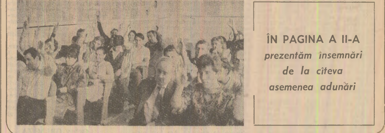
ÎN PAGINA A II-A prezentăm însemnări de la cîteva asemenea adunări

Pe temeiul remarcabilelor realizări obținute în anii de după Congresul al IX-lea, în lumina mărețelor perspective deschise de proiectul Programului-Directivă și a Tezelor pentru Congresul al XIV-lea, pe care le aprobă cu însuflețire, comuniștii întreprind — în adunările de dare de seamă și alegeri care au loc în această perioadă — analize profunde și exigente. Dezbaterile asupra muncii desfășurate de la alegerile precedente pînă în prezent sint caracterizate de un puternic spirit partinic, revoluționar, stabilind măsuri politico-organizatorice pentru îmbunătățirea și perfecționarea activității de partid, a ștului de muncă, a întregii activități economico-sociale. Intr-o atmosferă de însuflețitoare angajare revoluționară, într-o puternică unitate de cuget și simțiri, participanții la adunări își exprimă dorința fierbinte și adevine deplină ca tovarășul Nicolae Ceaușescu — cel mai iubit fiu al poporului, conducătorul strălucit al partidului și poporului — să fie reales în funcția de secretar general al partidului la marele forum al comuniștilor din luna noiembrie, vîzînd în aceasta garanția mersului victorios al României spre socialism și comunism.