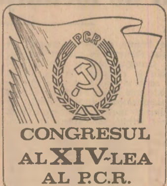
CONGRESUL AL XIV-LEA AL P.C.R.

prilej de analiză temeinică a întregii activităţi, înaltă şcoală de educaţie politică, revoluţionară