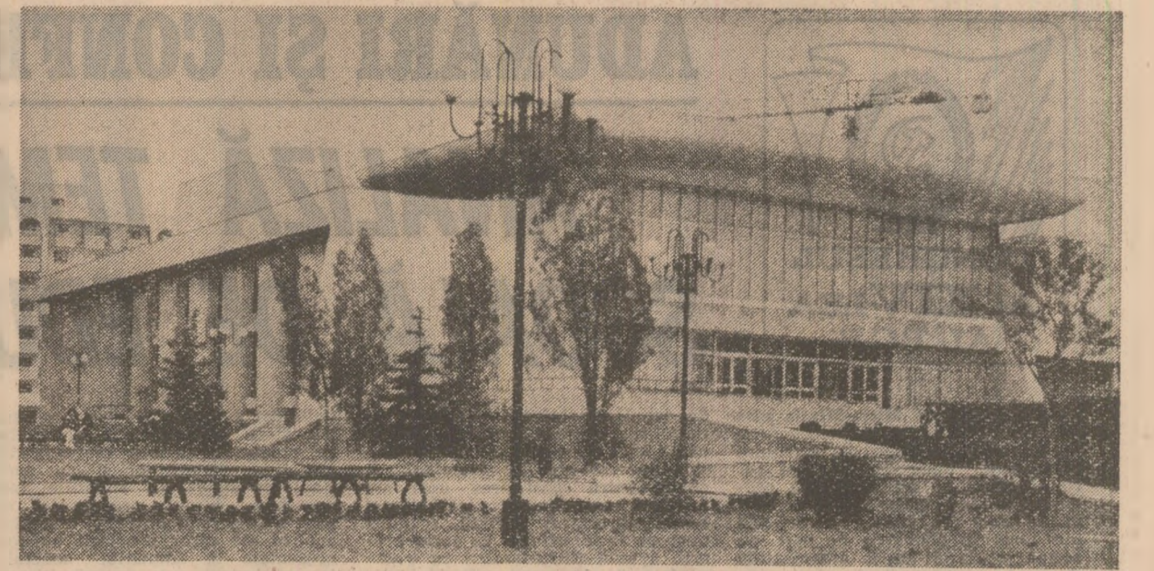
Centrul de creație și cultură „Cîntarea României” al sindicatelor din Ploiești