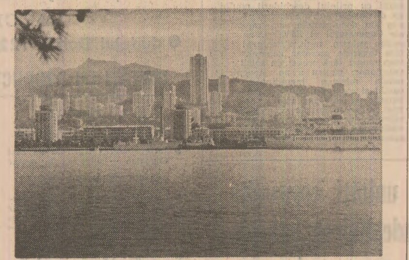
Imaginea orașului Wonsan, port la Marea de Est și important centru cultural al R.P.D. Coreeană

merosele sale vizite de lucru efectuate în acest oraș. „Nampho este imaginea” concentrată a dezvoltării economiei coreene, atît cu intensitate, cît și cu diversitate”. Și, într-adevăr, acest oraș este un important avanpost al industriei și, în egală măsură, un avanpost al agriculturii. De altfel, realizările orașului, ca și ale întregii țări sînt în mod nemijlocit și hotărîtor legate de activitatea vastă desfășurată de Partidul Muncii din Coreea, de la a cărui creare se împlinesc 44 de ani. Aplicînd adevăratele generale ale socialismului științifice la condițiile concrete, Partidul Muncii a sădit în rîndul maselor ideala „Cluce”, al căror sens, definit de tovarășul Kim Ir Sen, constă în „materializarea spiritului de independență și creator”, „rezolvarea tuturor problemelor puse în cadrul luptei revoluționare și al operelor de construcție în principal prin propriile forțe, în concordanță cu situația reală a țării”. În spiritul acestei orientări, în conducerea operelor de construcție socialistă un rol important are tovarășul Kim Giang Il, membru al Prezidiului Biroului Politic, secretar al C.C. al partidului, care desfășoară o intensă activitate politic-organizatorică pentru mobilizarea maselor în vederea împlinirii programului de dezvoltare a țării. În timpul documentării noastre am încercat să surprîdem — și sperăm că am și reușit — date edificatoare despre coordonatele esențiale ale dezvoltării orașului Nampho.