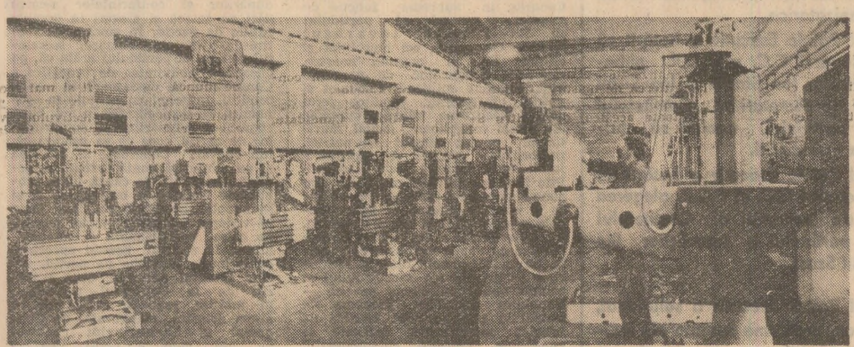
Intreprinderea „Infrătirea”-Oradea: in hala de montaj, se finalizează fabricația unui lot de mașini-unelte.

De altfel, a devenit aproape o regulă ca o dată cu reparatiile să se efectueze și lucrări de modernizare a utilajelor și instalatiilor. Mai refer la Combinatul Petrochimic din Pitesti, unde s-au efectuat modernizări substantiale, cu ocazia reparatiilor, la toate instalatiile; la fel se