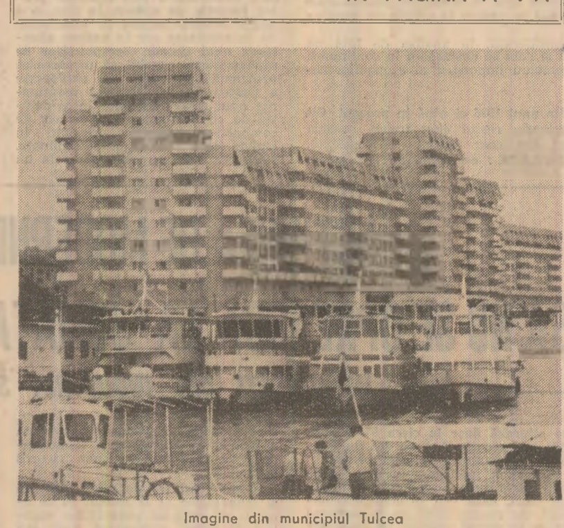
Imagine din municipiul Tulcea

Oamenii muncii din agricultură raportează încheierea recoltării unor culturi și obținerea de producții mari la hectar