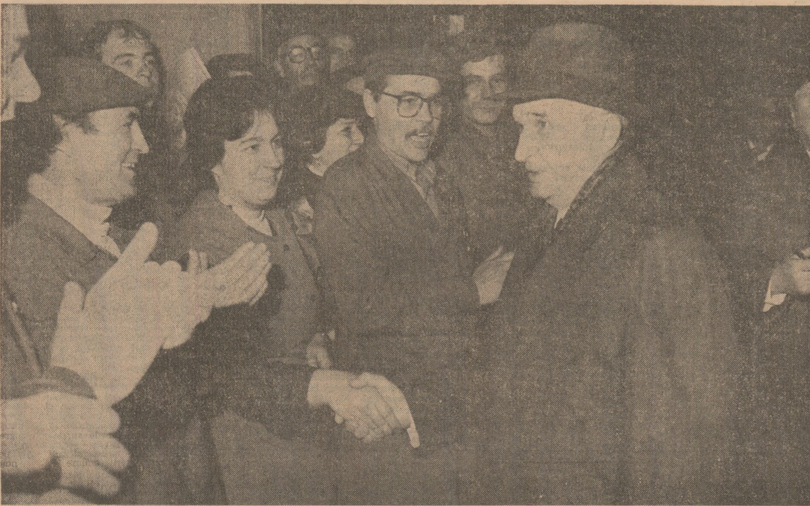
Tovarășul Nicolae Ceaușescu, secretar general al Partidului Comunist Român, prezidindele Republicii Socialiste România, s-a întâlnit, miercuri, în cadrul unei vizite de lucru, cu muncitorii și specialiștii din mari întreprinderi industriale și institute de cercetare științifică din Capitală.

Desăfășurată în preajma Congresului al XIV-lea al partidului, această nouă întâlnire a secretarului general al partidului cu oamenii muncii din municipiul București a prilejuit examinarea cuprinzătoare a rezultatelor obținute în îndeplinirea planului pe anul 1989, stabilirea măsurilor necesare pentru a asigura realizarea în cele mai bune condiții a obiectivelor actualului cincinal, pentru pregătirea condițiilor îndeplinirii neabătute a tuturor programelor de dezvoltare multilaterală a patriei.