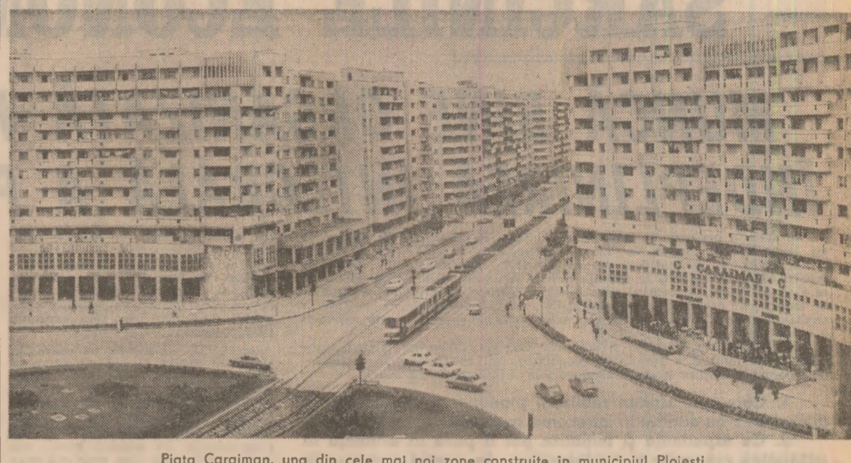
Piața Caraiman, una din cele mai noi zone construite în municipiul Ploiești.

Tovarășul Nicolae Ceaușescu, secretar general al Partidului Communist Român, președintele Republicii Socialiste România, a primit, miercuri, pe So Dong Bon, redactor-șef adjunct al ziarului „Nodon Sinmun”, organul de presă al Comitetului Central al Partidului Muncii din Coreea. Cu acest prilej, tovarășul Nicolae Ceaușescu a acordat un interviu pentru ziarul „Nodon Sinmun”.