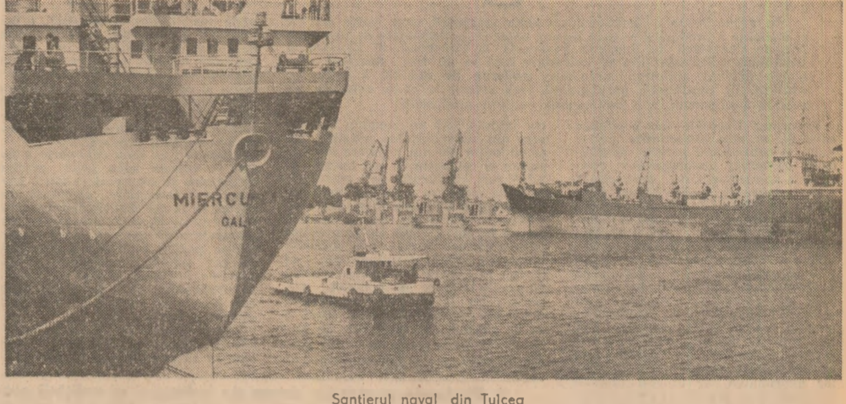
Santierul naval din Tulcea