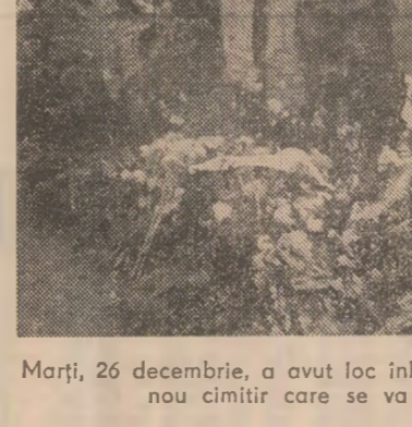
Marți, 26 decembrie, a avut loc înmarea tinerilor eroi ai revoluției într-un nou cimitir care se va numi „Cimitirul eroilor tineri“

Dr. Moses Rosen, șef rabinul Culturii mozaice, președintele Federației Comunităților evreiești din România, a adresat un mesaj în care se spune: „În numele tuturor comunităților evreiești din România, în numele slujitorilor Culturii mozaice, în numele nostru personal, vă încredințăm de devotamentul nostru neprecupțit pentru cauza poporului român, care a răsturnat tirania și și-a cucert libertatea printr-o luptă de un eroism înegalabil.“