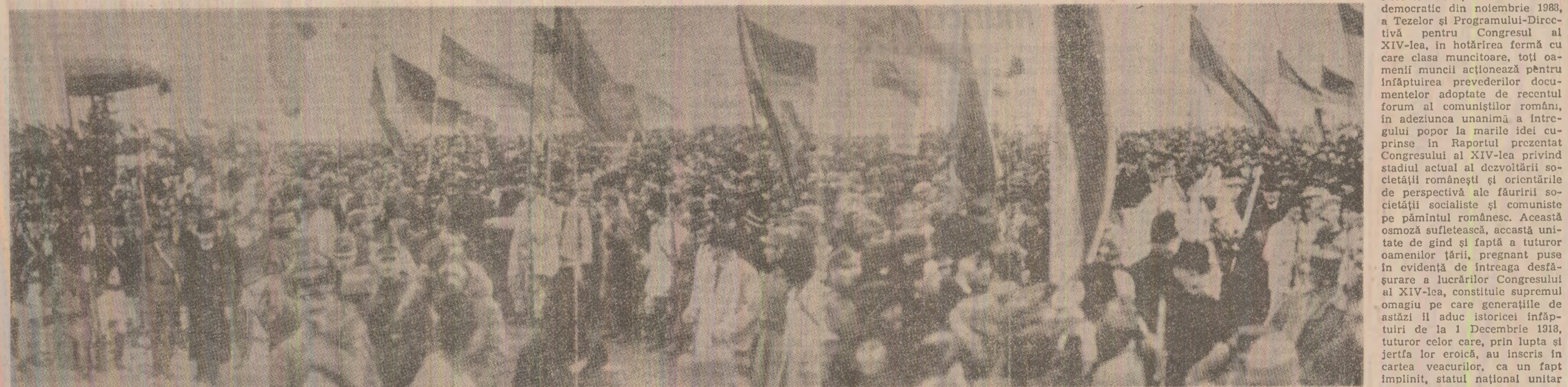
1 Decembrie 1918, Marea Adunare Națională de la Alba Iulia, care a proclamat Unirea Transilvaniei cu România