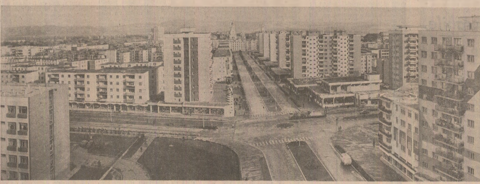
Din noua arhitectură a municipiului Alba Iulia