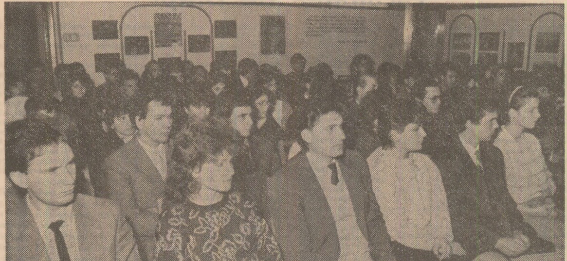
La Centrul Universitar București

Cu profundă și neîmărunțită admirație și recunoștință pentru toți cei gîndiți și înfăptuiți spre binele și fericirea poporului, însușiții de eroicul dumneavoastră exemplu de viață și luptă revoluționară, mult iubite și stimate tovarășe Nicolae Ceaușescu, noi, toți studenții Centrului Universitar București, ne angajăm să muncim și să învățăm fără preget, să acționăm ca buni specialiști, ca devotați patriei revoluționare, pe măsura grandioasei dezvoltări a societății românești, a grijii și încrederii pe care ne-o acordăți pentru a ne aduce contribuția activă, responsabilă la înflorirea multilaterală a țării noastre, vînd în această expresia supremă a dezvoltării noastre neabătute, a hotărîrii noastre neabătute, a nea face, în toate împrejurările, datoria față de patrie și partid.