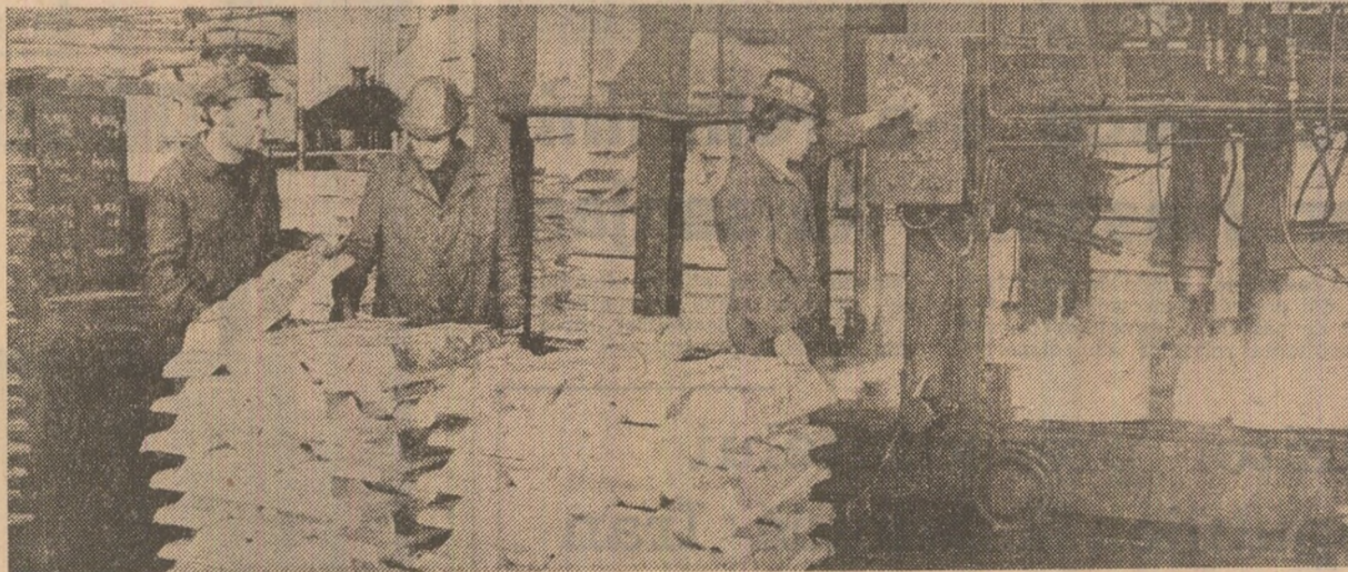
Secția turnătorie a Întreprinderii de Alumină, Slatina

Avînd în vedere exigențele impuse de traducerea neabătută în viață a obiectivelor de dezvoltare economică-socială, pentru realizarea obiectivului strategic de trecere a țării noastre la un nou stadiu de dezvoltare — acela de țară socialistă mediu dezvoltată — organizatiile de partid, consiliile oamenilor muncii, toate celelalte organizații de conducere trebuie să acționeze cu maximă răspundere, să urmărească modul în care se pregătește producția anului viitor, să se implice în rezolvarea problemelor încă nesoluționate. Practic, întreaga producție trebuie organizată în așa fel încît, pretutindeni să existe sarcinile îndeplinite în toamă la sarcinilor de plan asumate pentru 1990, la toți indicatorii, a tuturor programelor de dezvoltare economică-socială a țării.