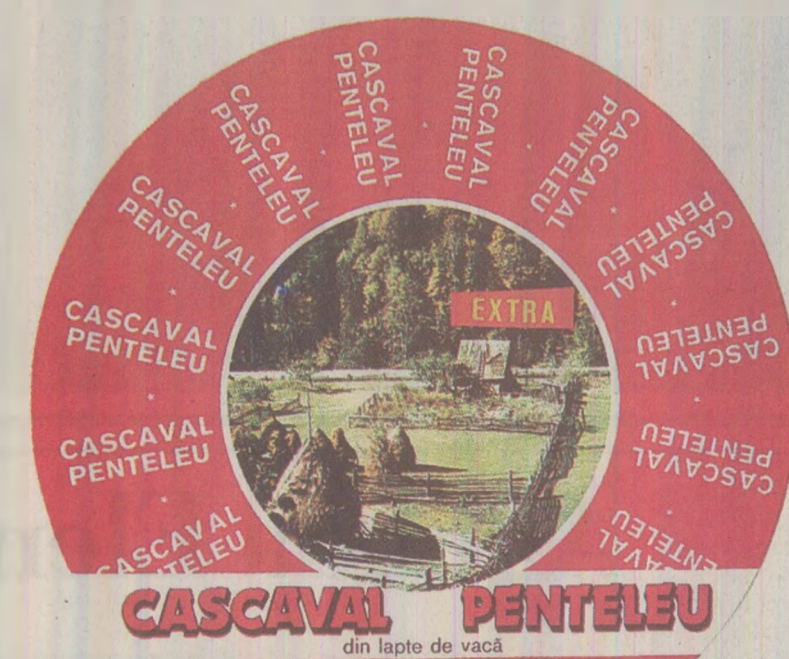
Tare ca piatra, iute ca săgeata. Cascavalul nu apuca să stea prea mult prin rafturile magazinelor. Pe mesele românilor ajungea mai ales de Sărbători