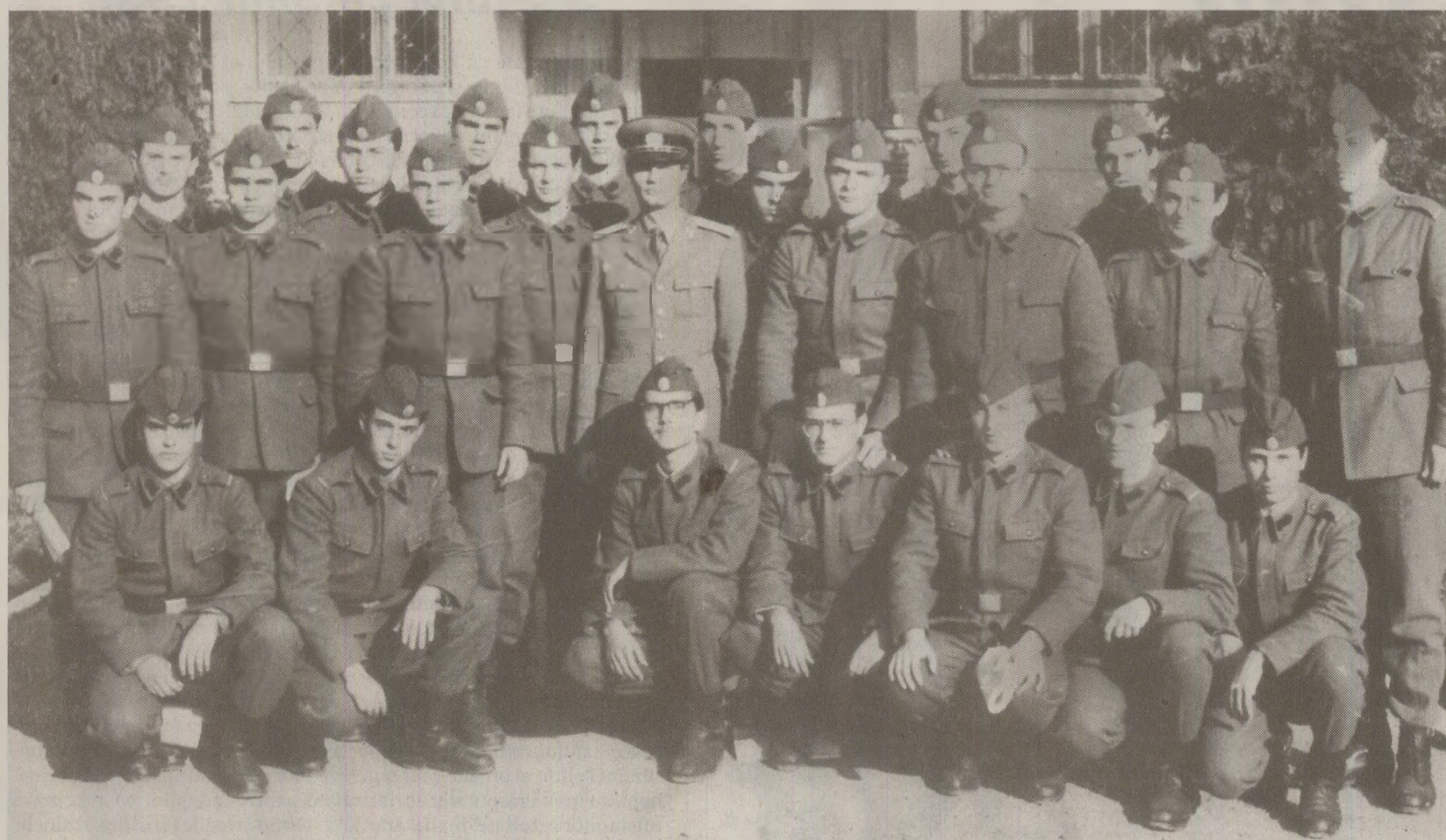
Tinerii recruți erau nevoiți să asculte ore în șir și discursuri propagandistice

La 19 ianuarie, în unitățile și instituțiile militare de învățământ erau în desfășurare adunările generale de dare de seamă și alegerile organizațiilor UTC. Adunările trebuia să dezbăte modul în care birourile UTC au acționat sub îndrumarea organizațiilor de partid pentru educarea comunistă și revoluționară a tinerilor militari. Fiecare organizație UTC-istă mai trebuia să-și facă autocritica și să își ia noi angajamente pentru îndeplinirea sarcinilor ce rețeauă pentru