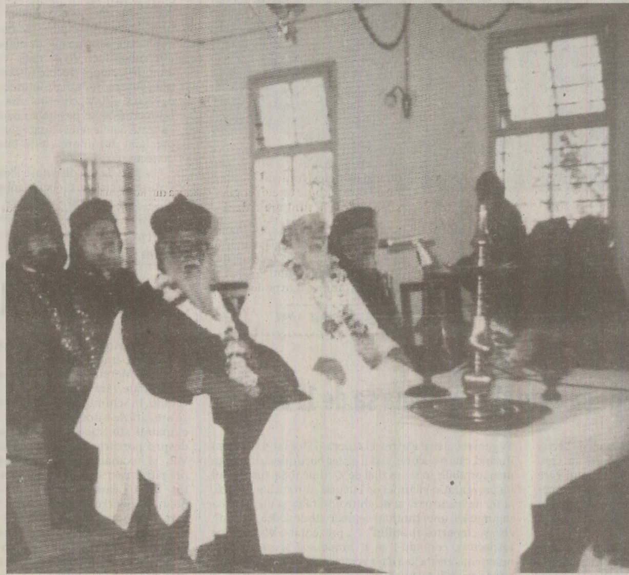
Patriarhul Teoctist, lângă Sanctitatea Sa Basilius Mar Thoma Mathews I, Catolicos al Răsăritului și al Bisericii Ortodoxe Siriene din India, la Seminarul din Kottayam, India