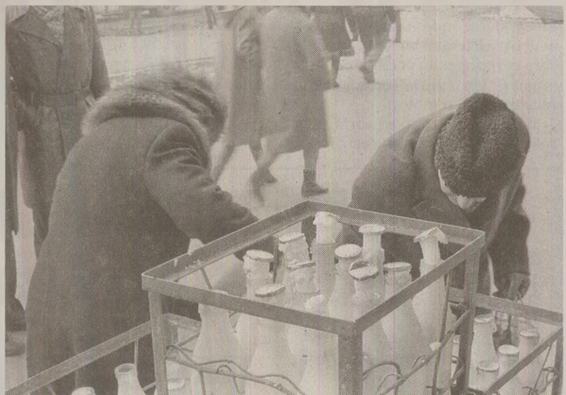
Industria laptelui, în „vizorul” speculatorilor

a prosperat banda de la Fundeni, condusă de directorul Iordache, numai că proporțiile pagubei în avutul obștesc, așa cum au fost ele reținute de rechizitoriu, sunt cu adevărat cosmice: - 13 tone de unt (valoare 579,25 lei) - 73 tone de telemea (valoare 281.162 lei) - 6 tone de smântână (valoare 138.690 lei) - 4,1 tone de brânză de vaci (valoare 74.502 lei) - 1450 kg lapte raf