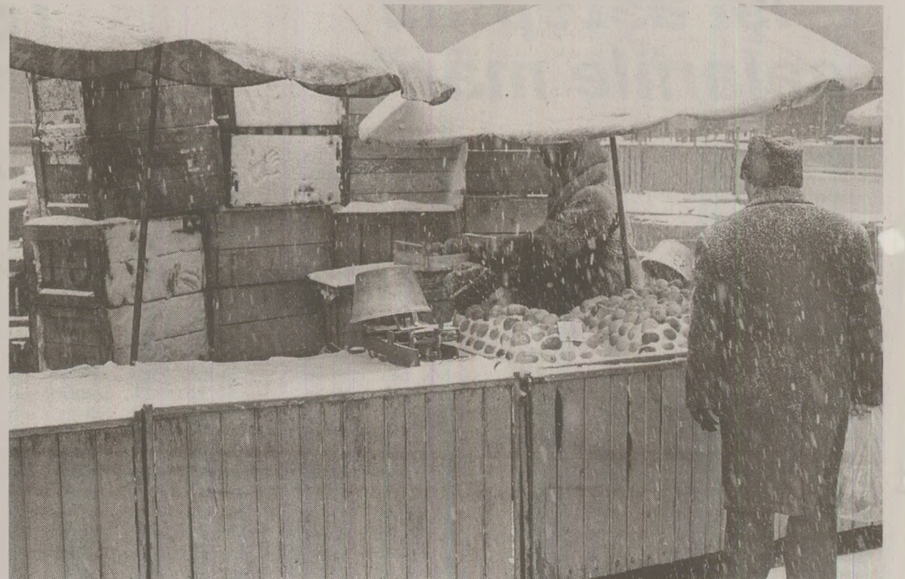
Presă americană din ianuarie 1989 prezenta pe larg condițiile dificile de trai ale românilor