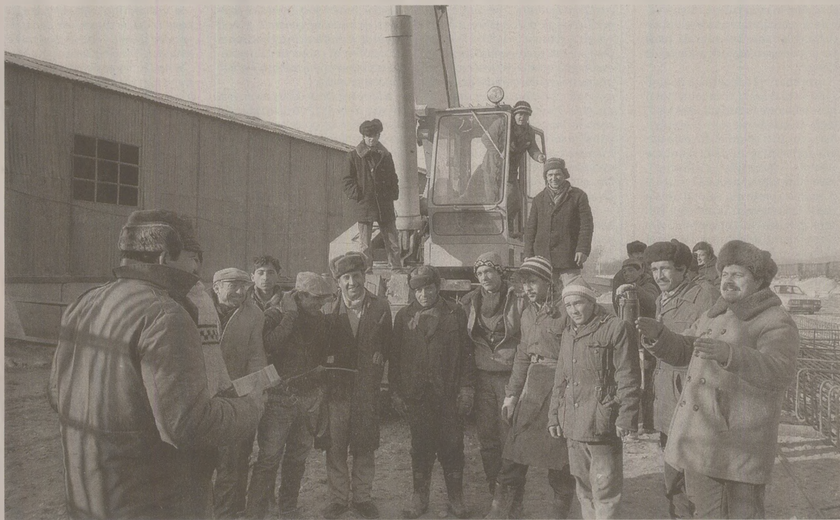
Muncitorii au primit cu entuziasm decizia Comitetului Central al PCR de a le majora salariile.

O bună parte din români, cei cu salarii cuprinse între 2.000 și 2.250 de lei, așteptau în a doua jumătate a lui ianuarie 1989 să ia salarii mărite. Creșterile erau cuprinse între 17,5% și 19,9%, ceea ce însemna ceva în acea vreme, când exista o mare stabilitate financiară și prețurile erau constante mulți ani.