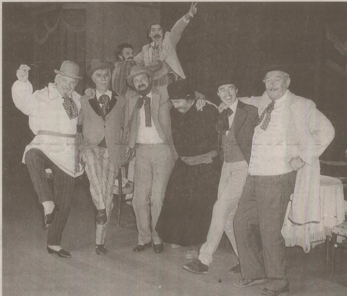
Scenă din actul III al piesei de teatru „O scrisoare pierdută”