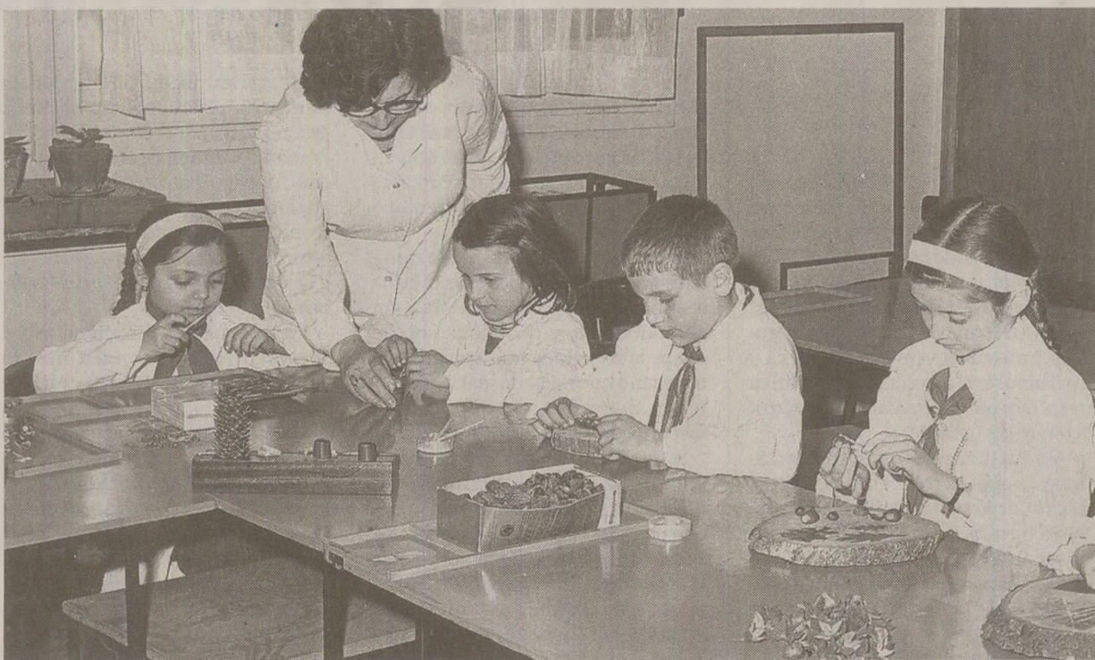
Copii din școli și din grădinițe își confecționează singuri jucării. Bani pentru achiziții nu existau în 1989.

Jucării greu de uitat sunt și Rățoiul Donald de fabricație românească, rața cu gâtul lung de plastic pe care