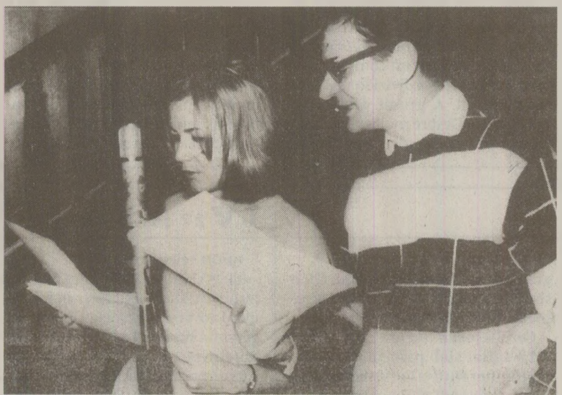
Emisiunea „Ora Veselă”, denumită mai târziu „Unda Veselă”, încălzea sufletele românilor în ianuarie 1989.