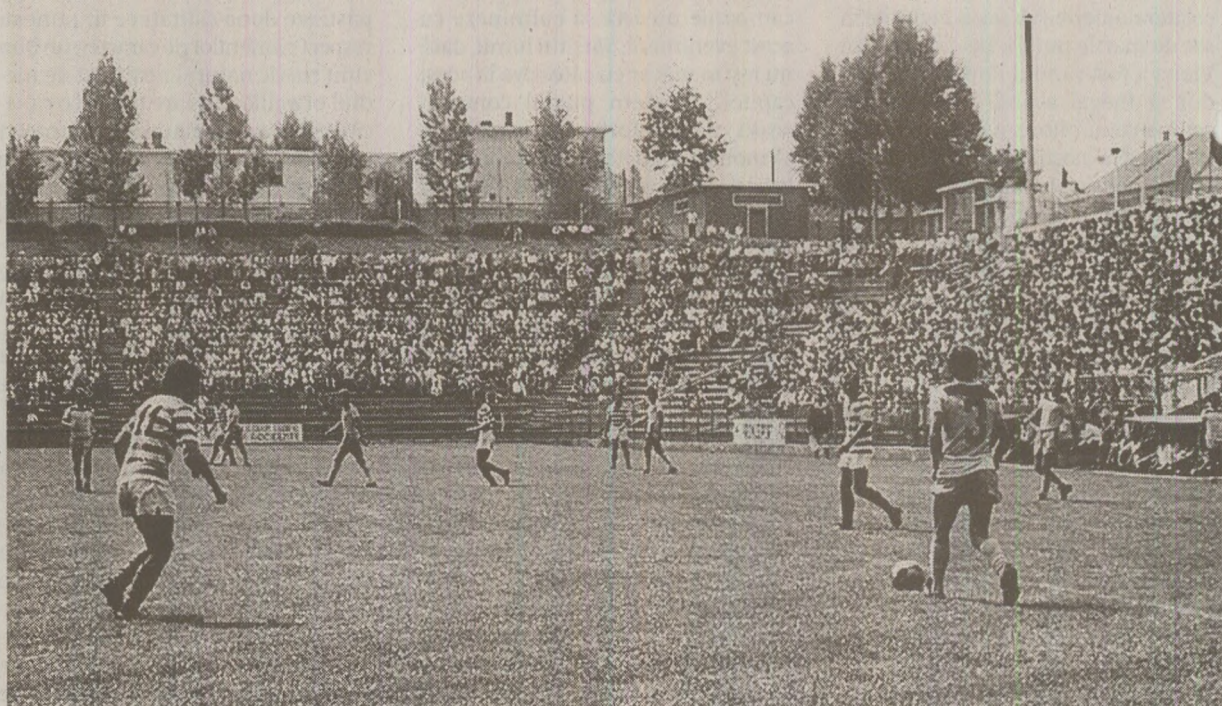
Meciurile din Divizia B atrăgeau mulți spectatori.