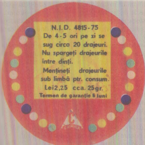
Bomboanele Cip puteau fi consumate în număr de 20 de bucăți pe zi, în 4-5 repize