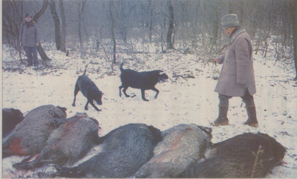
Un grup de mistreți prezentând onorul tovarășului Secretar General