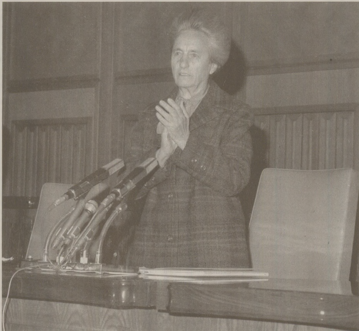
În anii '80, Elenei Ceaușescu îi plăcea puterea din ce în ce mai mult.

Încă din 1980, regulat Elena Ceaușescu a fost asociată cu mai multe luări de cuvânt ale lui Ceaușescu la nivel internațional; se întâmpla datorită promovării ei în postul de prim-viceprim-ministru în martie 1980. Atât în 1981, cât și în 1989, decretate prin care i-a fost acordat ordinul de Erou al Republicii au menționat contribuția ei la reprezentarea țării pe plan extern. În scrisoarea trimisă de Comitetul Politic Executiv cu ocazia aniversării din ianuarie 1989, „strălucita activitate” depusă pentru a reflecta „spiritul partidului și al statului nostru pe plan extern” a fost repetat menționată alături de alte merite. Mai puțin