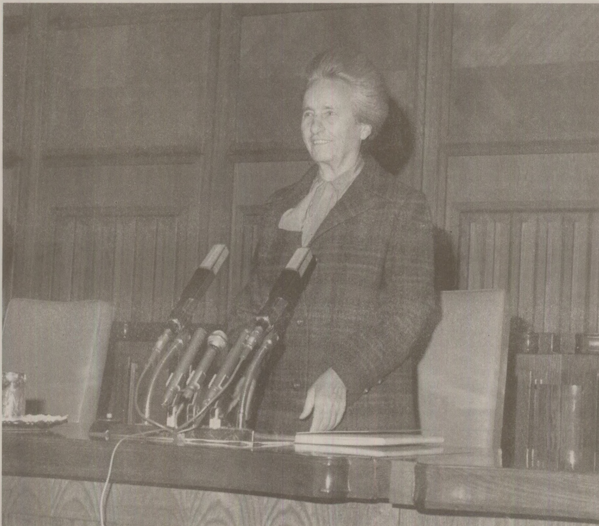
Pe lângă jurnaliștii de la Europa Liberă, Elena Ceaușescu era cea mai probabilă succesoră al „conducătorului iubit”

Anul acesta, festivitățile au prezentat toate elementele asociate cultului personalității Ceaușeștilor; iar acoperirea mediatică extinsă nu a surprins deloc. Chiar și cei mai fini observatori vestici ai României - să nu mai vorbim de însăși populația țării -, au putut evita grea senzația unui déjà-vu legat de aceste evenimente. Într-adevăr, ascultarea termi-