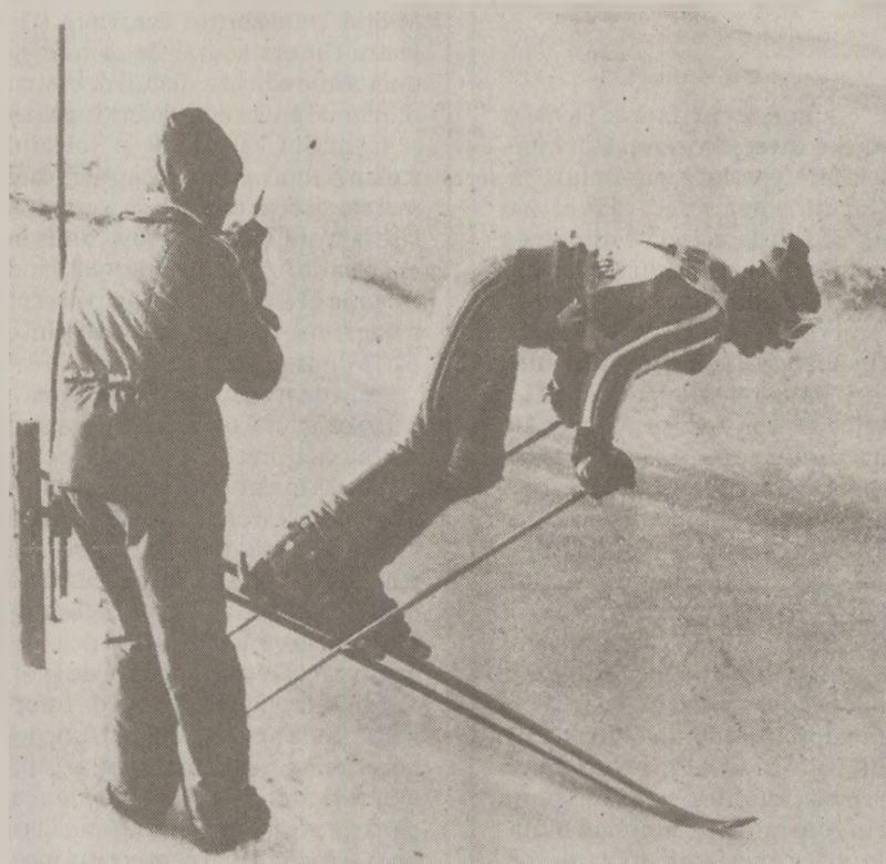
În România anulul 1989, practicarea schiului de performanță era o tentativă fără succes.