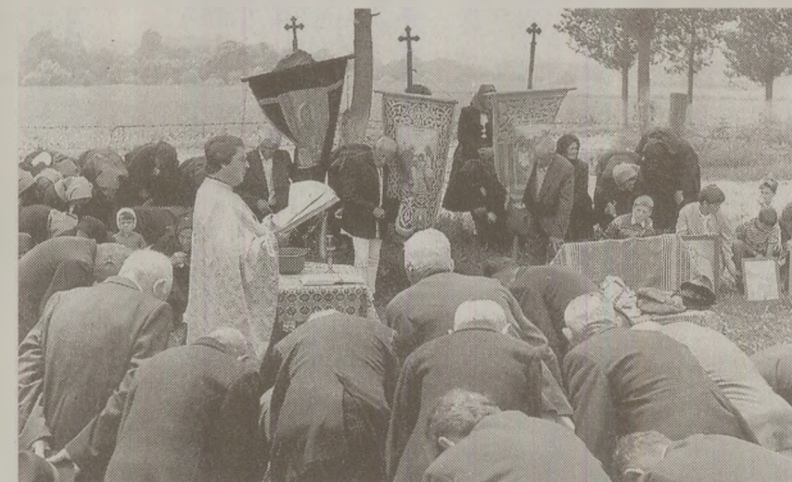
Țărani se rugau să le crească roadele pe câmp, ca să aibă bani pentru birul la stat