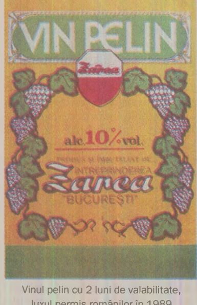
Vinul pelin cu 2 luni de valabilitate, luxul permis românilor în 1989