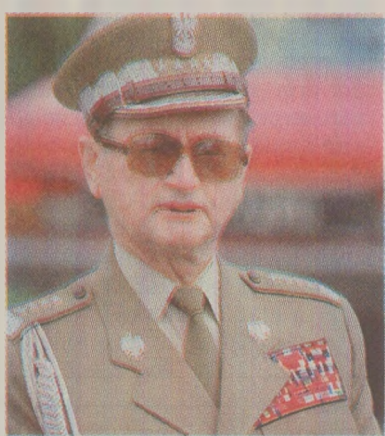
Polonezii considerau că Jaruzelski (foto) și Ceaușescu erau ultimele rămășițe ale autoritarismului în Europa de Est.