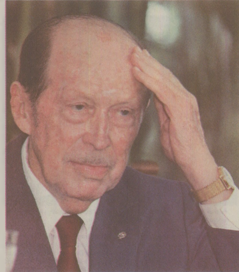
După 35 de ani de dictatură, Alfredo Stroessner a fost debarcat de la conducerea Paraguayului, primul-lovitură de stat

Născut în 1912, într-o familie bogată, Alfredo Stroessner a cunoscut primele succese ca militar. În 1948, devenea cel mai tânăr general din toată America de Sud. În 1954, președintele Tomas Romero l-a numit comandat al forțelor armate paraguayene. Câteva luni mai târziu, Stroessner prelua puterea, instaurând o dictatură care avea să dureze 35 de ani.