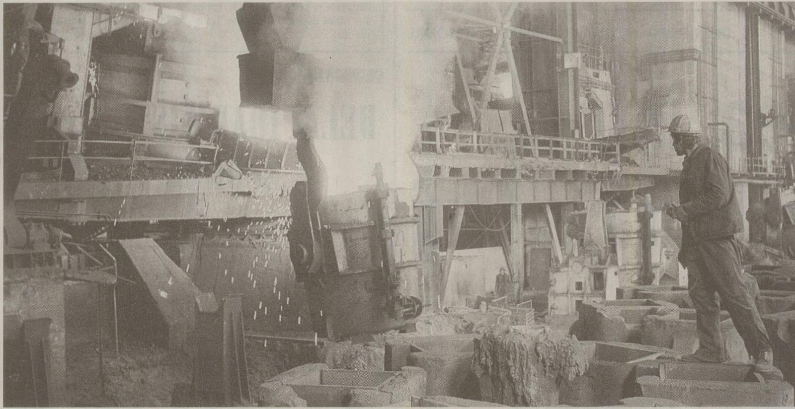
Combinatul de Oțeluri Speciale din Târgoviște, una dintre „unitățile-model” ale industriei siderurgice AGERPRES

Trei ani mai târziu, la 14 decembrie 1973, cu ocazia unei vizite de lucru a secretarului general al partidului, tovarășul Nicolae Ceaușescu, în județul Dâmbovița, a fost elaborată prima șarjă de oțel la Târgoviște. Șarja inaugurată a acestei noi vetre siderurgice era semnul unor promițătoare orizonturi de dezvoltare a orașului și ea avea o semnificație aparte, cu valoarea simbol, prin faptul că se petrecea în prezența președintelui țării. După cum este cunoscut, un moment însemnat în cronica acestui oraș îl constituie perioada activității revoluționare, neobosite și curajoase a tovarășului Nicolae Ceaușescu, care în anii de luptă grea ai ilegalității, ca secretar al regionalei Valea Prahovei a UTC, la începutul anului 1936 a fost arestat la Ulm, în apropiere de Târgoviște, făcând parte din grupul comunistilor judecați de un tribunal militar la Brașov și fiind condamnat la 2 ani și 6 luni închisoare la Doftana. De altfel, în iulie 1969, când s-a hotărât con-