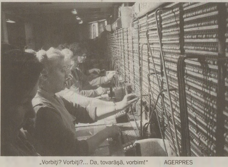
„Vorbiți? Vorbiți?... Da, tovarășă, vorbim!” AGERPRES

comunica, deh, era mare lucru! Asta când radele aveau telefon acasă. Dacă nu, se ducea la avis. Îți dădeai întâlnire pe fir a doua zi, la o anumită oră. Rudele sau cunoștințele mergeau la poșta din localitatea lor, după cum erau anunțat prin mandatul telefonic. Telefonista suna din nou la județ și cei de acolo te puneau în legătură cu persoana căutată. Îți răspundea dintr-o altă cabină de la poștă, „Alo!”, iar vocea telefonistei te „veghea”: „Vorbiți?”.