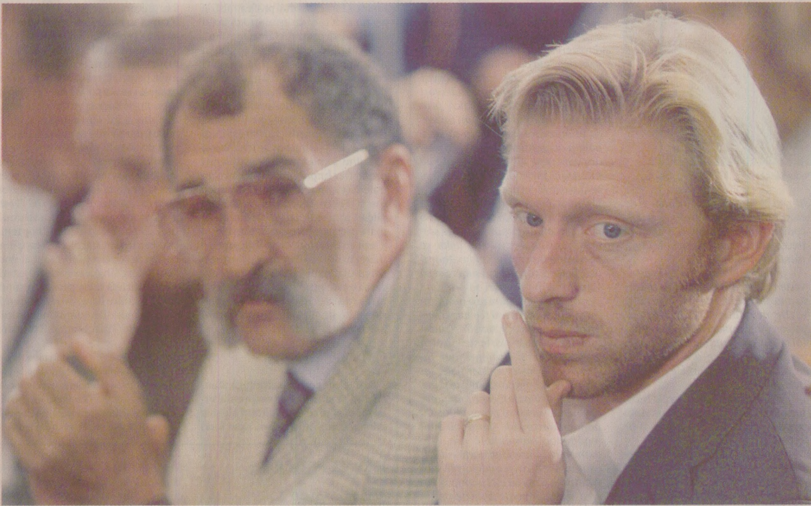
Cariera lui Boris Becker, tânără speranță a tenisului în 1989, a fost influențată decisiv de Ion Țiriac, supranumit „guru” în acea vreme

Ion Țiriac este cel mai puțin iubit în tenisul internațional. Un tip înspăimântător! Pe un ring de catch sau într-un western ar deține rolul Răului. Statura impunătoare (1,82 m, 90 kg), cu mustață groasă pleoștită, cu o claie de păr ondulat, picioarele arcurate și ochii strălucind accentuând aerul lui de urs din Carpați. Un urs de care toată lumea se teme, și lui îi place să cultive această imagine. Niciodată un surâs. Totdeauna sumbru și grăbit. Adesea, la limita dintre corectitudine și provocare. Ca jucător, între 1962 și 1972, a jucat de mai mult de o sută de ori în Cupa Davis pentru România.