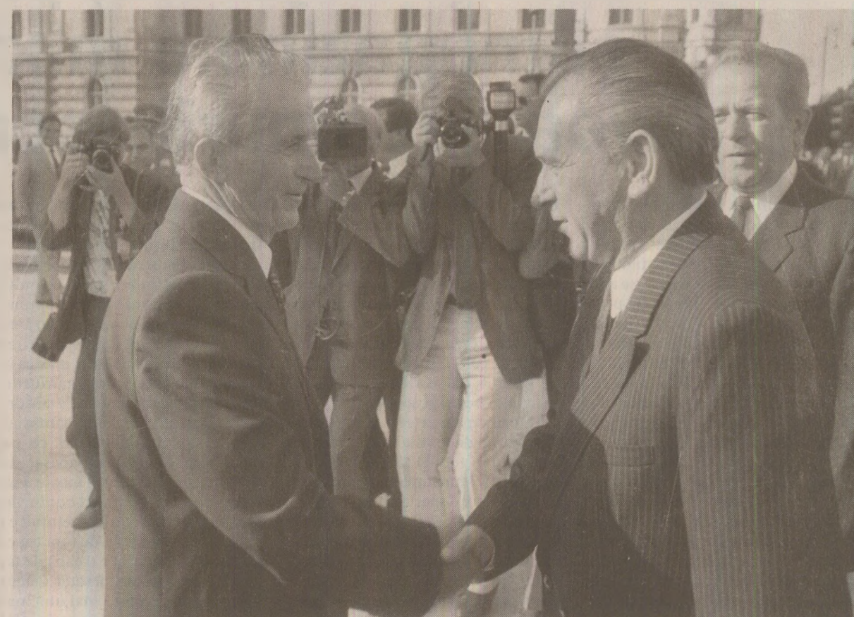
Întâlnirea liderului maghiar Karol Grosz cu Ceaușescu în 1988, nu a îmbunătățit relațiile dintre cele două state