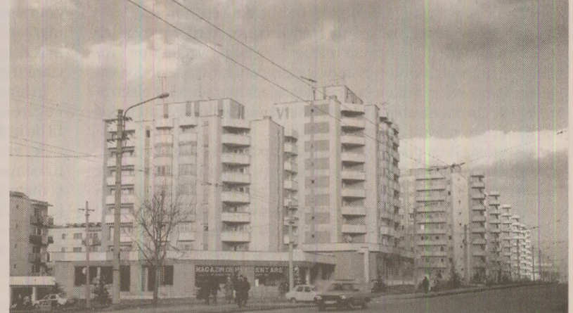
Din cauza economiilor la energie electrică, locatarii blocurilor-turm erau nevoiți să urce 8-10 etaje pe jos.

Maria Bogdan RADU Flacăra, nr. 1752 din 1989