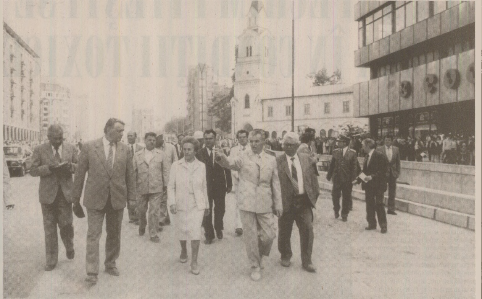
Propagandiștii Comitetului Central prezentau în afara țării sistematizarea Bucureștiului ca fiind o mare realizare a „Epoicii Nicolae Ceaușescu”

voltate; înfăptuirea consecventă a principiului construirii socialismului cu poporul și pentru popor; orientările politicii partidului nostru cu privire la alocarea unei părți însemnate a veniturii naționale pentru fondul de acumulare; perfecționarea sistemului de conducere și planificare economico-socială, aplicarea principiilor autoconducerii și autogestunii, a mecanismului economico-financiar; necesitatea creșterii tot mai puternice a rolului conducător al partidului și statutului al organismelor democrației muncitorești revoluționare; rolul activității ideologice și politico-educative în formarea și afirmarea conștiinței socialiste, a omului nou, constructor conștient și devotat al socialismului și comunismului; orientările și principiile fundamentale ale partidului și statutului nostru în domeniul politicii externe, originalitatea și profunzimea inițiativelor românești ale secretarului general al partidului, tovarășul Nicolae Ceaușescu, în forumurile internaționale cu privire la rezolvarea complexelor probleme cu care se confruntă omenirea.