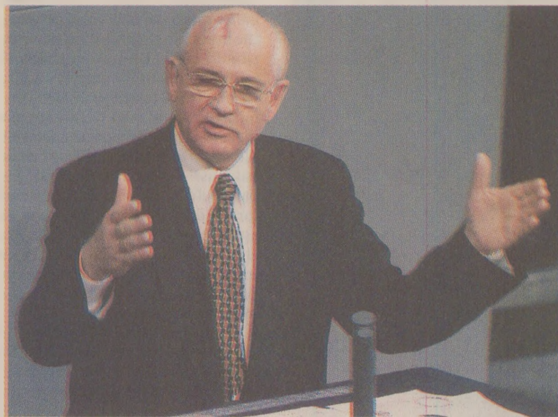
După lansarea Perestroicii de către Mihail Gorbaciov, liderii comunisti așteptau reforme democratice în tot blocul comunist.

Despre adevărata atitudine, din spațiile scenei, a liderilor sovietici nu se poate decât specula. În timp ce oficialii sovietici spun că „propriu exemplu e cea mai bună predică”, oficialii est-europeni spun că, deși omologii sovietici dau dovadă de flexibilitate atât la întâlnirile bilaterale și multilaterale, sunt în continuare duri și au pretenții mari, în special din domeniul economic. Totuși, anul trecut în luna octombrie, în cadrul unei discuții private din biroul său, Károly Grosz mi-a spus că nu mai este necesar și nici nu se mai obișnuiesc să se mai ceară acordul Moscovei înainte de a întreprinde o nouă inițiativă. Povestea că de curând, înainte să ia o decizie dificilă, i-a dat telefon lui Gorbaciov pentru a-i cere „părerea”. Răspunsul a fost că Grosz