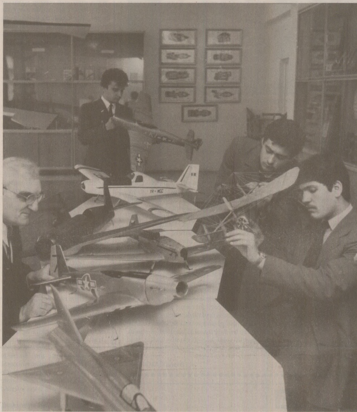
Elevii de la Liceul Industrial nr. 3, actualul Grup Școlar „Henri Coandă” din București, aveau ore de modelaj în atelierele-școli.