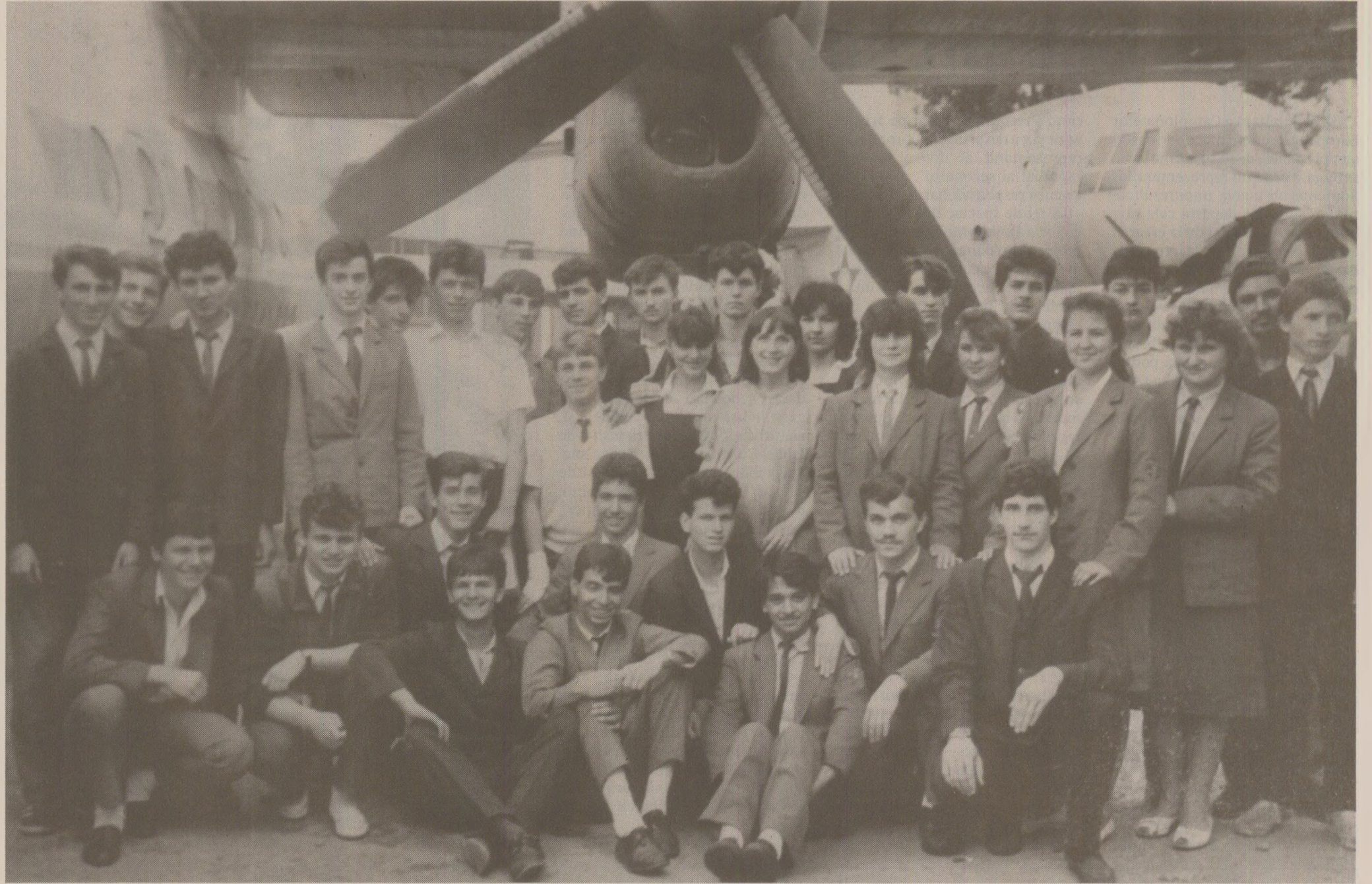
La sfârșitul anilor '80, la liceul de aviație erau clase de 40 de elevi, majoritatea băieți