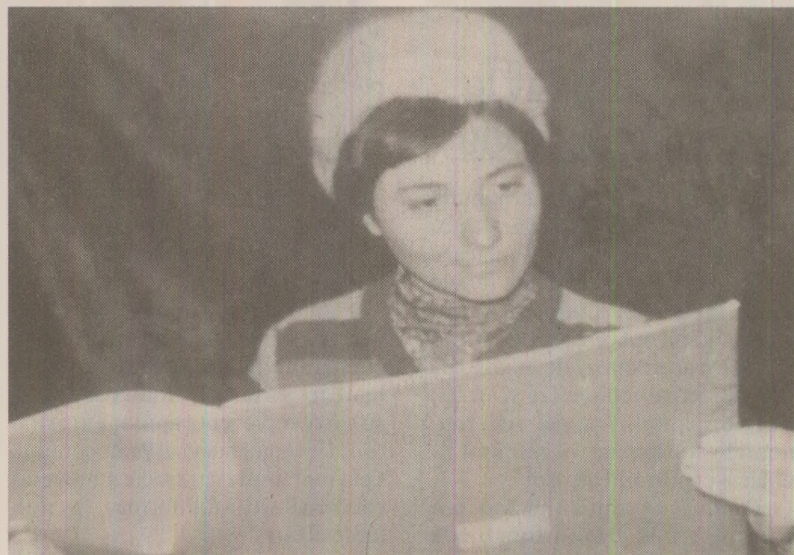
Când era vorba de învățământ politic, profesorii se transformau și ei în elevi sfoși, care tremurau de teama examenatorului

Una dintre tinerele învățătoare de atunci s-a numărat și ea, la sfârșitul lui 1988, printre cei notați cu «insuficient», deci era corigentă la politica partidului! Asupra ei au început să se facă presiuni să devină membru PCR. Și cum, atunci când intrai în partid, în fața organizației de bază ti se puneau o smedenie de întrebări pentru a se constata dacă ești pregătit politic, învățătoarea avea motivul să refuze înscrierea în partid pe baza calificativului. Dar exista o normă și la numărul de membri noi, așa că a mai interesat pe nimeni calificativul ei. După multe insistențe, la începutul anului 1989 a devenit membră de partid, dar, după cum se știe, nu s-a bucurat prea mult de această «onoare»!