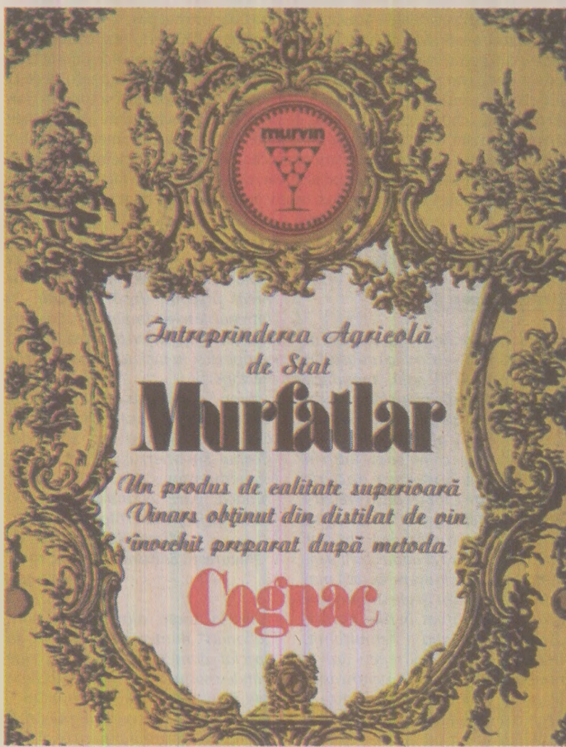
Coniacul de Murfatlar, același gust bun în toate timpurile