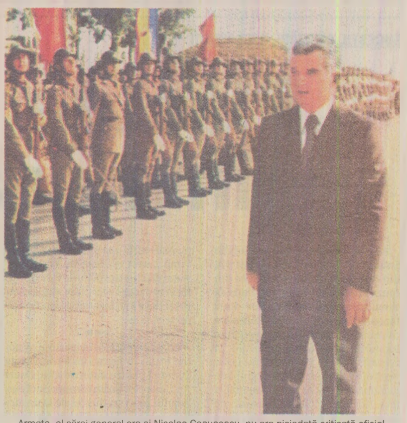
Armata, al cărei general era și Nicolae Ceaușescu, nu era niciodată criticată oficial