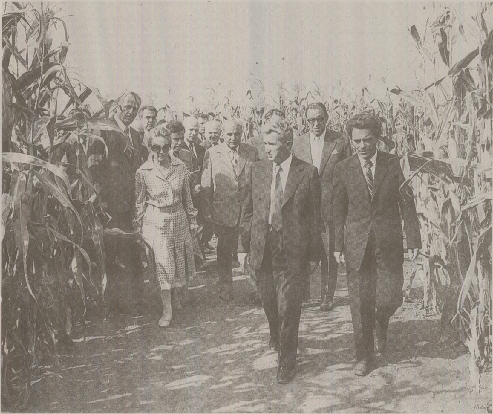
În ultimii ani de viață, Nicolae Ceaușescu era obsedat de realizările „noii revoluții agrare”